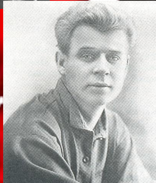
Сергей Александрович Есенин