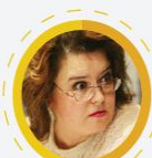
СКОРОЛУПОВА Оксана Алексеевна

директор Департамента государственной политики в сфере общего образования Минобрнауки России