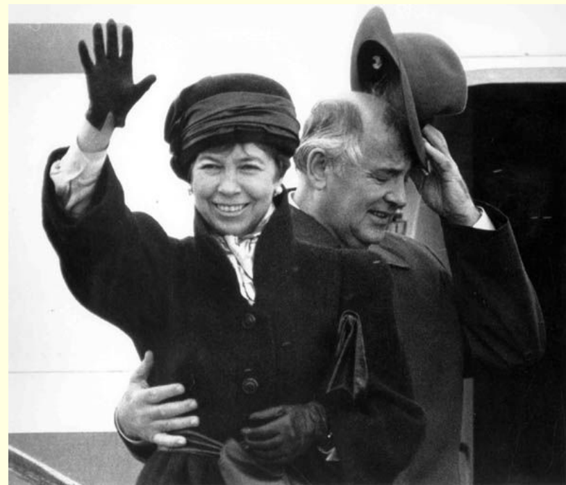
Перед отлетом в Исландию. Москва, 10 октября 1986.

Раиса Максимовна, как жена главы государства, сопровождала мужа во всех его поездках по стране и за рубежом, впервые в советской истории появившись на общественной сцене в роли «первой леди». Не все советские люди благожелательно восприняли новый образ жены Генерального секретаря ЦК КПСС.