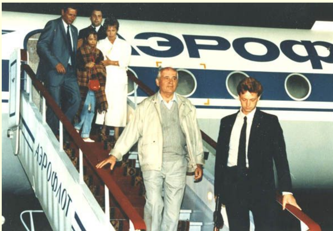
М.С.Горбачев с семьей возвращается из Фороса. 22 августа 1991

Во время событий августа 1991 года был отстранён от власти ГКЧП во главе с вице-президентом Геннадием Янаевым и изолирован в Форосе после ареста членов ГКЧП вернулся из отпуска на свой пост.