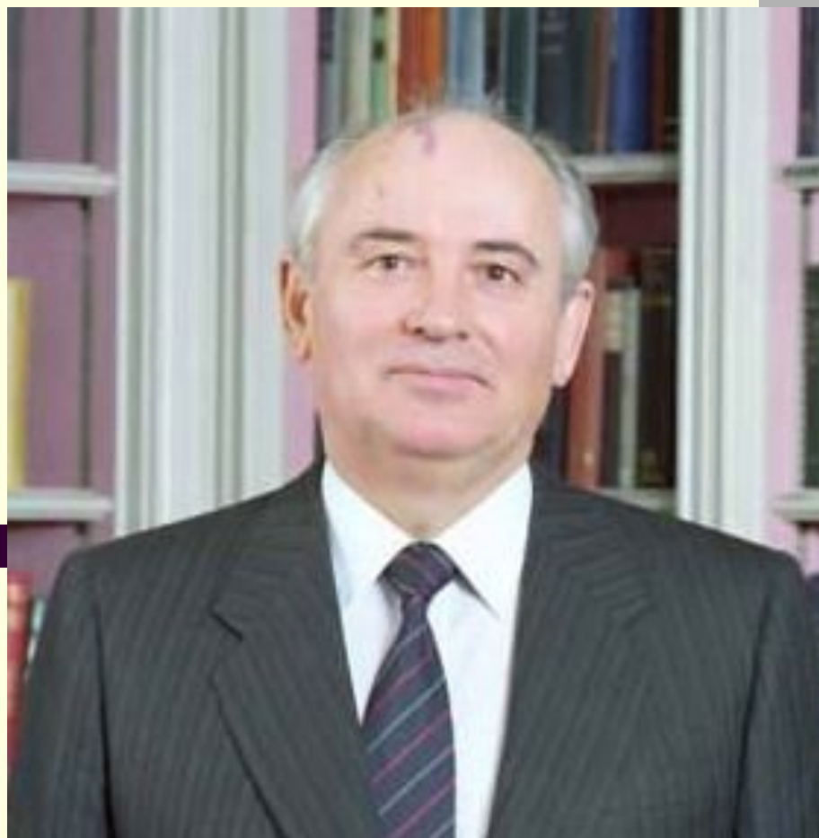
Михаил Сергеевич Горбачёв