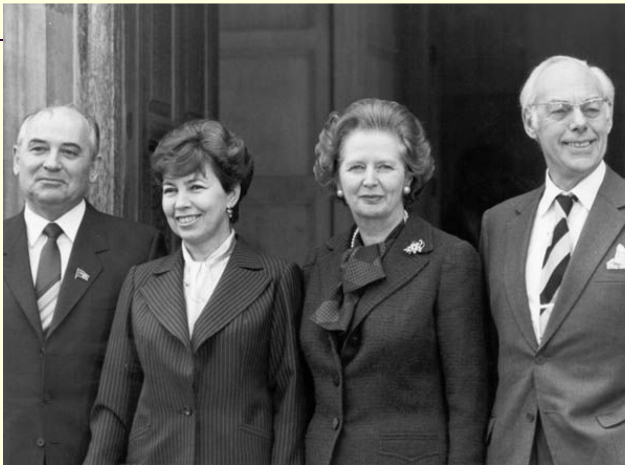
Михаил и Раиса Горбачевы, Маргарет и Дэнис Тэтчер. Лондон, 16 декабря 1984.

В начале 80-х годов совершил ряд зарубежных визитов, в ходе которых познакомился с Маргарет Тэтчер.