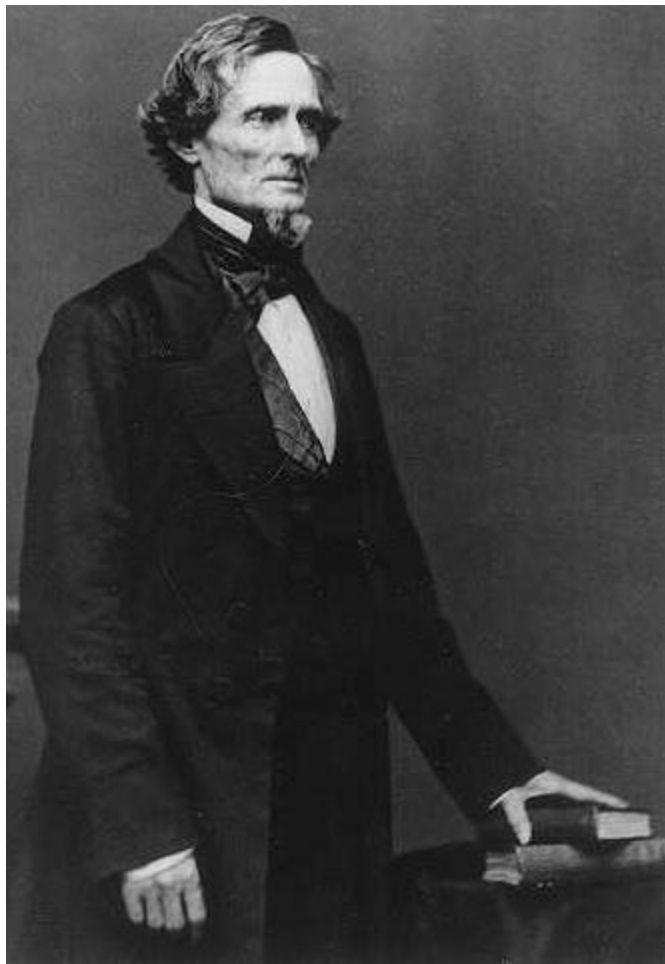
Джефферсон Дэвис - президент Конфедерации