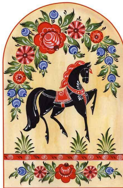
Городецкий конь. Панно - 2

Городецкая роспись — русский народный художественный промысел. Существует с середины XIX века в районе города Городец. Яркая, лаконичная городецкая роспись (жанровые сцены, фигурки коней, петухов, цветочные узоры-розаны и пионы), выполненная свободным мазком с белой и черной графической обводкой, украшала прялки, мебель, ставни, двери.