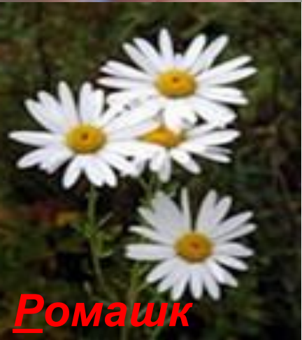
Р омашк а