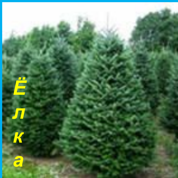
Ё л к а