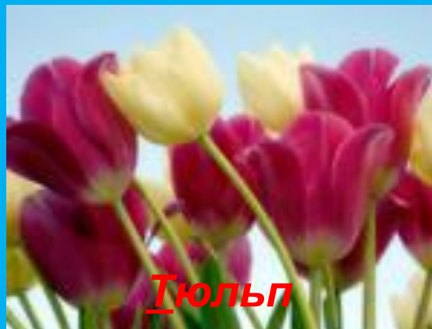
Т юльп ан