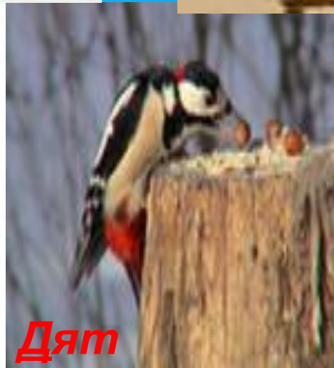
Д ят ел