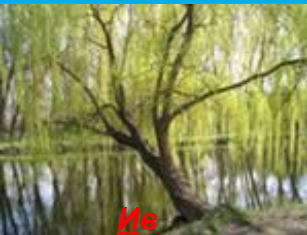
И в а