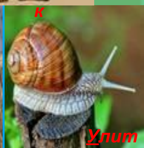
У лит ка