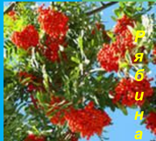
Р я б и н а