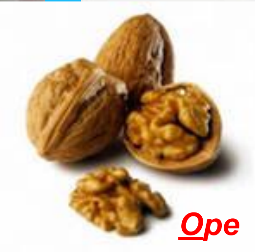
О ре х