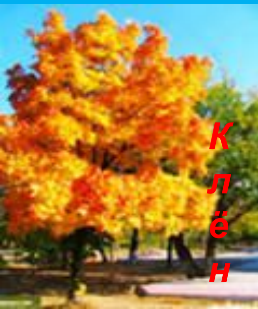
К л ё н