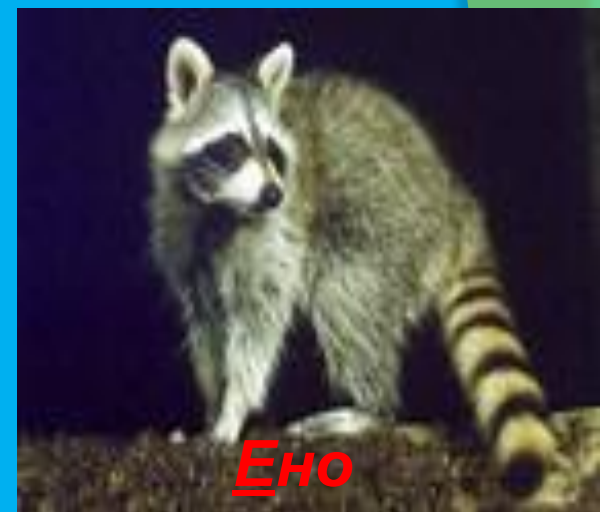
Б но т