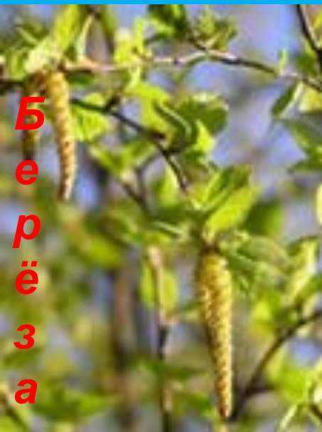
Б е р ё з а