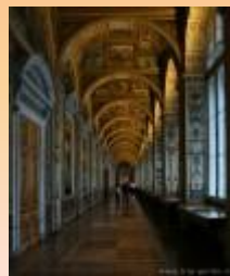
Эрмитаж, Лоджии Рафаэля