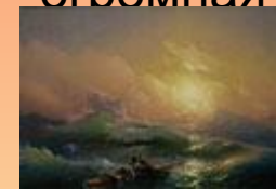
И.К. Айвазовский. Девятый вал. 1850 г.

Основные экспозиции размещены в помещениях Михайловского замка и в корпусе Бенуа. Художественные ценности расположены также в Мраморном и Строгановском дворцах, садово-парковом ансамбле Летнего сада с Летним дворцом Петра I и Михайловском саду. На этих площадях может проводиться до 50-ти выставок одновременно. Кроме того, экспозиции разворачиваются в различных городах России и за рубежом.