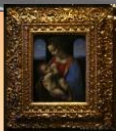
Леонардо да Винчи "Мадонна с Младенцем (Мадонна Литта)"

Эрмитаж в Санкт-Петербурге является одним из самых известных музеев не только в Северной столице, но и во всем мире. Вместе с такими музеями мира как Лувр, Метрополитен и Британский музей он обладает богатой коллекцией и является одним из самых посещаемых музеев мира. В настоящее время коллекция музея насчитывает более 3 000 000 экспонатов. Это в первую очередь картины и скульптуры, предметы прикладного искусства, а также другие произведения искусства. Если рассматривать каждый экспонат по одной минуте, то потребуется 8 лет, чтоб осмотреть всю коллекцию. Для осмотра коллекции необходимо пройти 100 км.