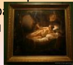
"Даная" Рембрандт Харменс ван Рейн