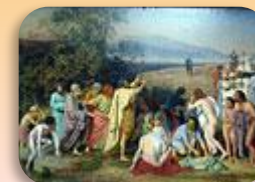
А. Иванов. Явление Христа народу