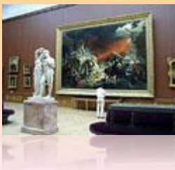
К. Брюллов. Последний день Помпеи. 1833