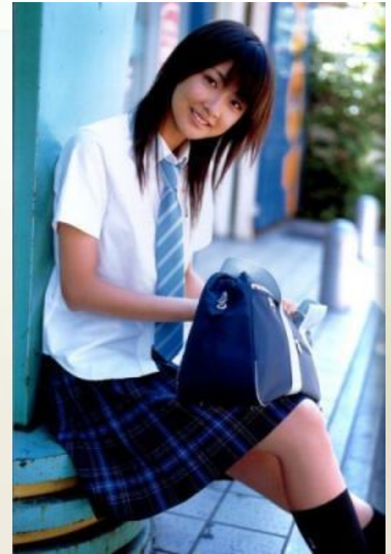
Школьная форма в Японии