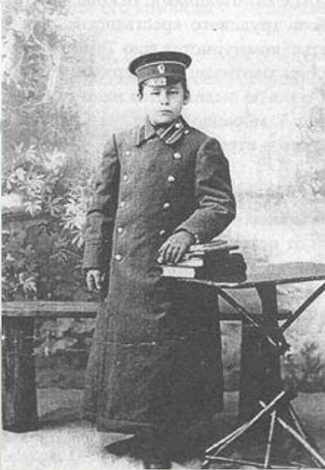
Царская школьная форма