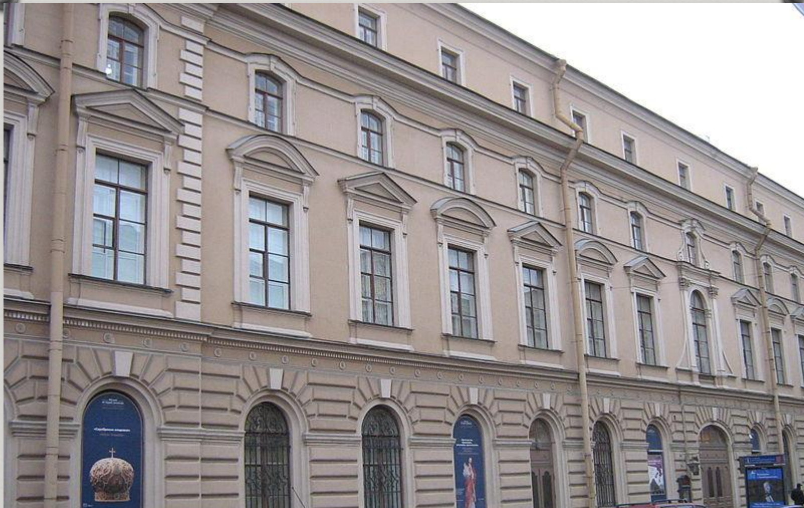
Санкт-Петербург, Почтамтская ул., дом 14/5