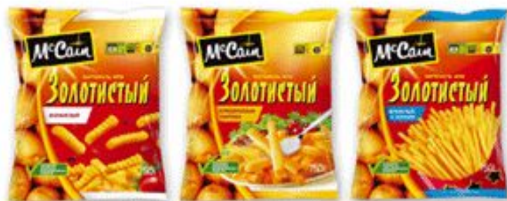
Упаковка картофеля "Золотистый" от McCain, 2007 г., США