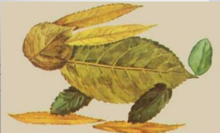
«Зайчик прискакал в огород»