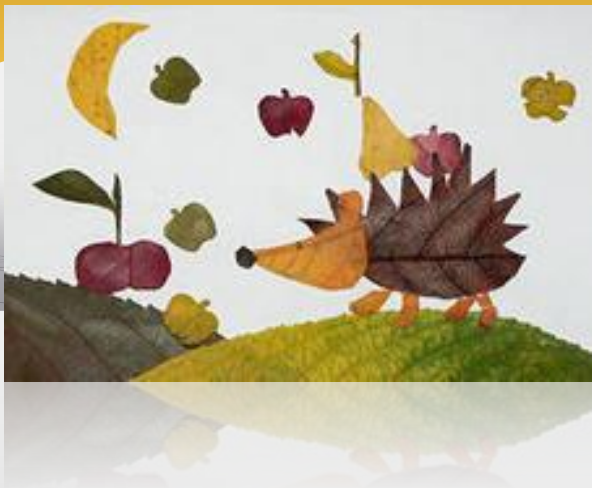
«Ежик и Луна»