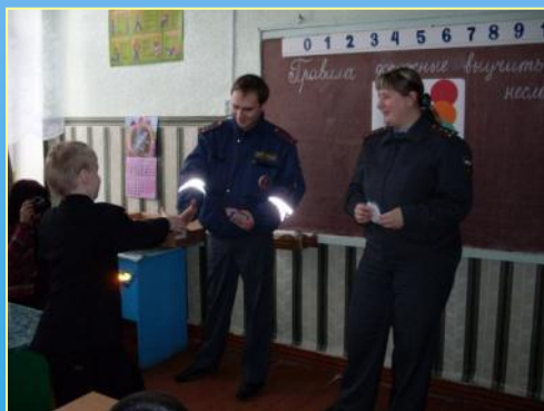
Вручение значка пешехода

Участие в районной акции по безопасности дорожного движения «Правила дорожные выучить несложно»