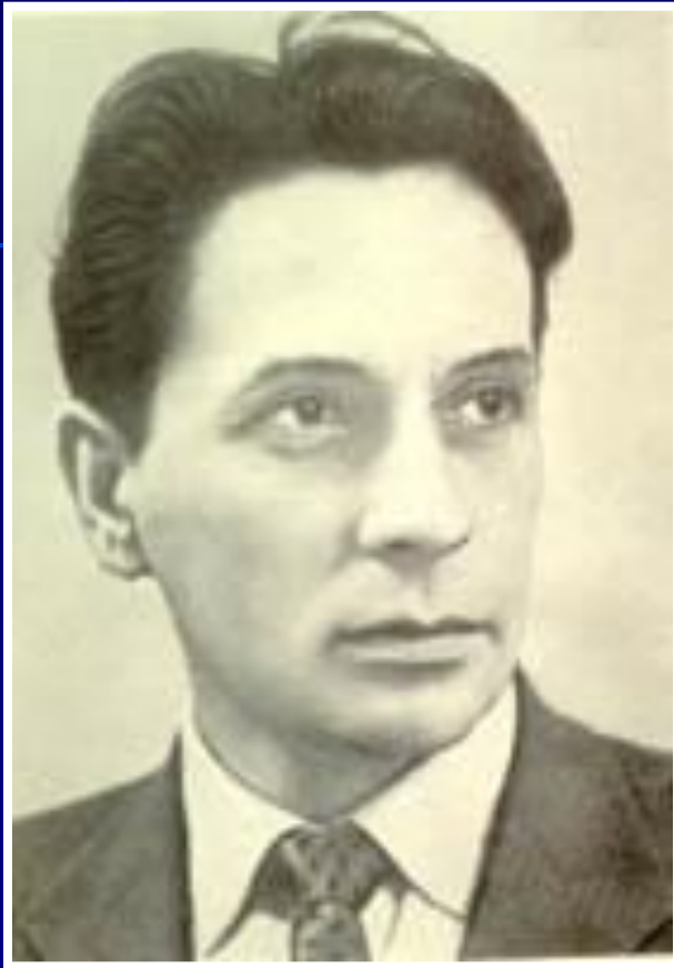
Ф. Абрамов, фото 50 – х годов.

Закончив аспирантуру и защитив кандидатскую диссертацию по творчеству М. А. Шолохова, Ф. Абрамов в 1951 году стал преподавателем Ленинградского университета.