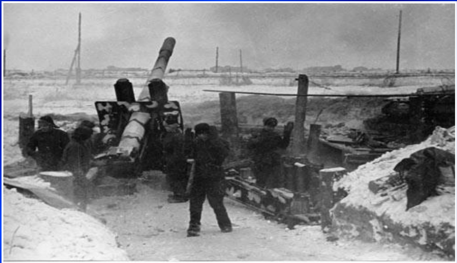
Бой под Ленинградом, зима 1941г.

Мы знаем об этом времени со слов автора :