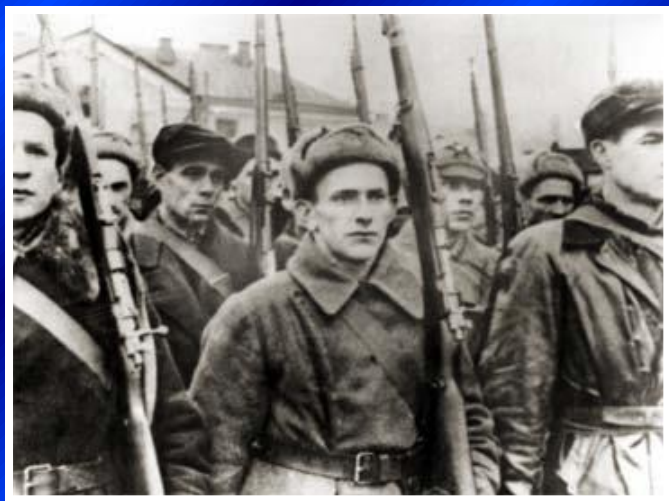
Народное ополчение под Ленинградом, 1941 г.

Она застала Ф. Абрамова на третьем курсе. В день объявления войны он добивался, чтобы у него приняли экзамен, и подал заявление о зачислении его добровольцем в ряды Красной армии.