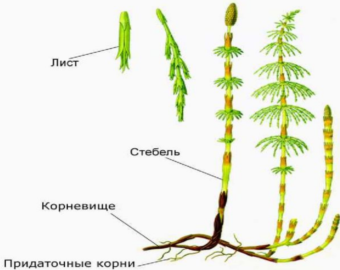
Вегетативные органы хвощей