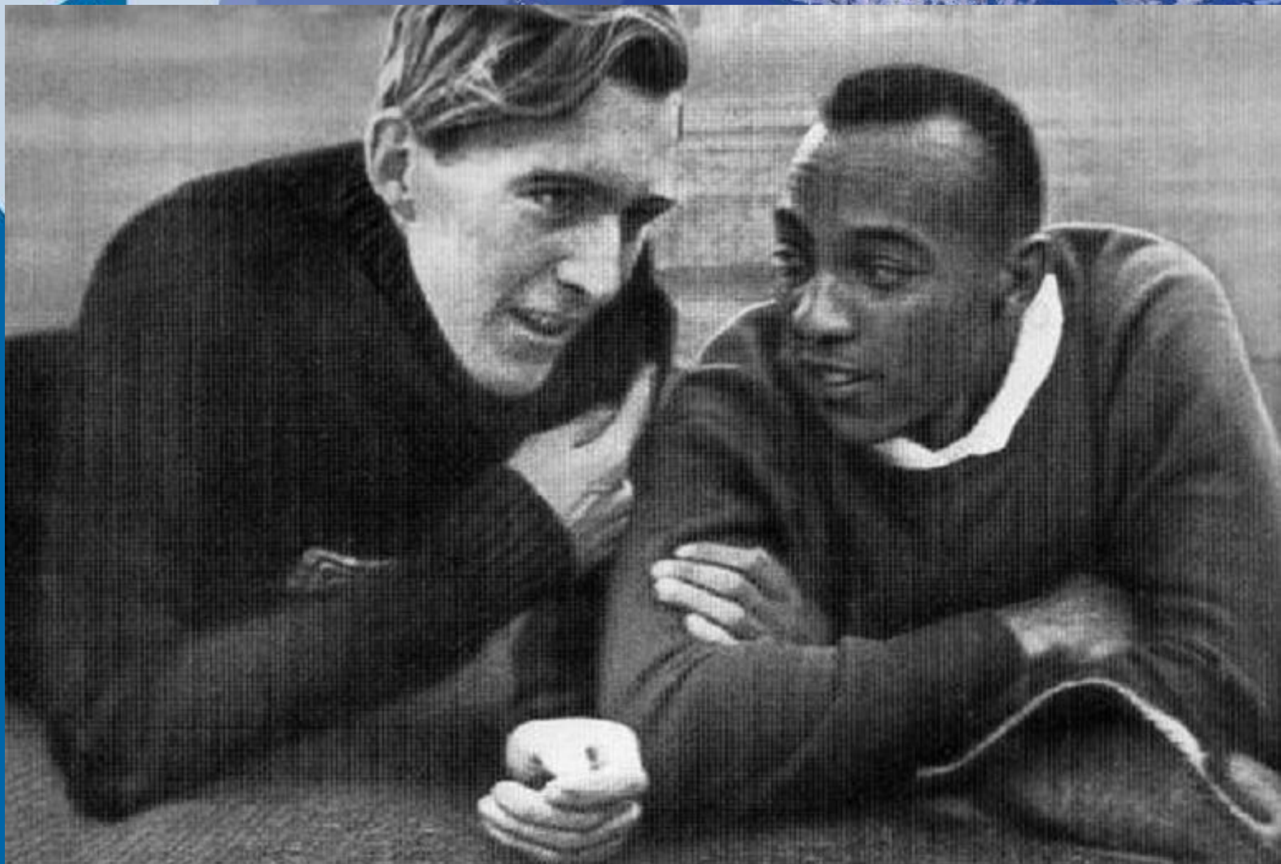
Лутц Лонг и Джесси Оуэнс