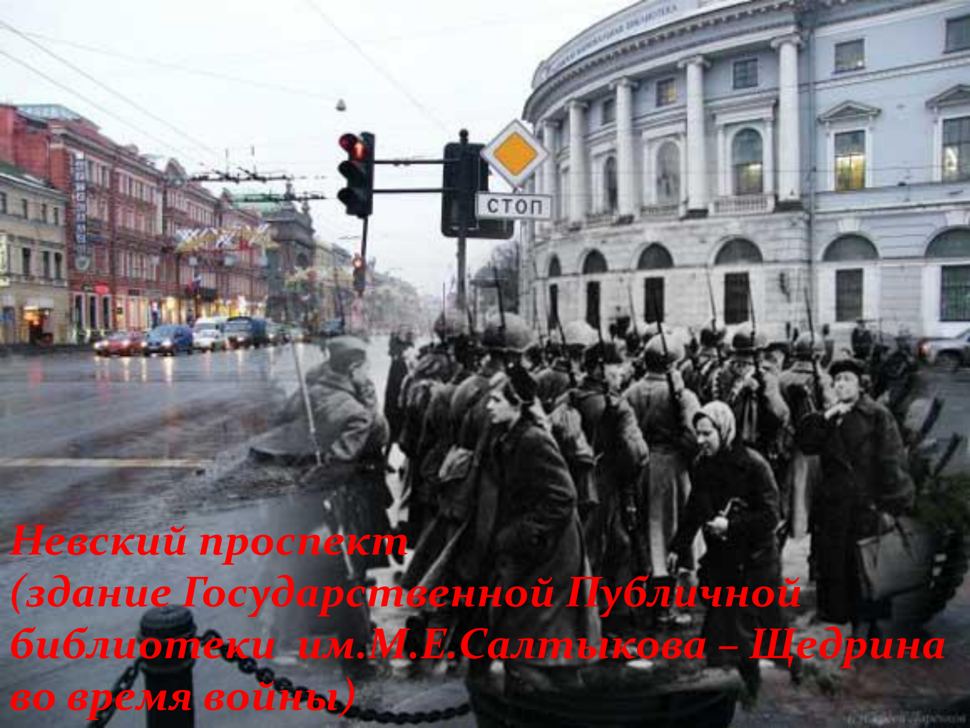
Невский проспект (здание Государственной Публичной библиотеки им.М.Е.Салтыкова – Щедрина во время войны)