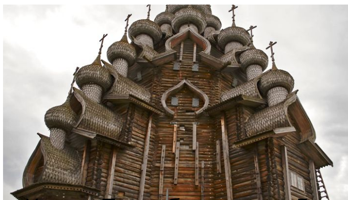
Храм Преображения Господня. Кижы. Россия