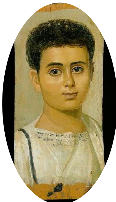
Фаюмский портрет. Египет.