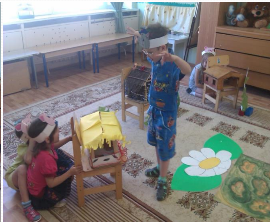
Сюжетно-ролевая игра «Три поросенка»