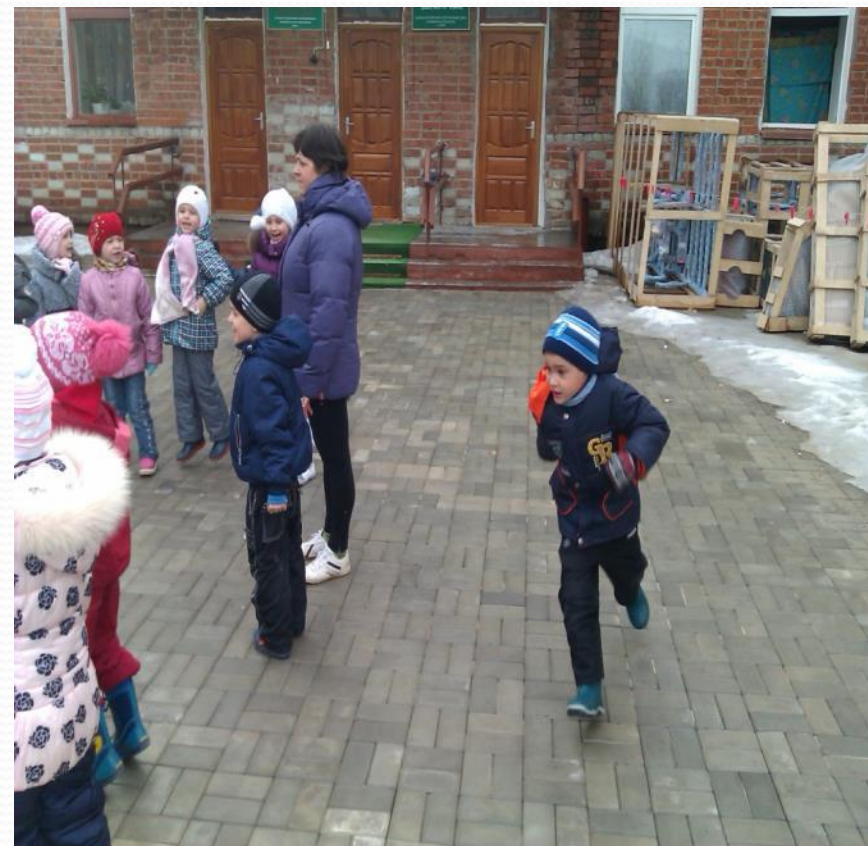
Прогулка (подвижная игра)