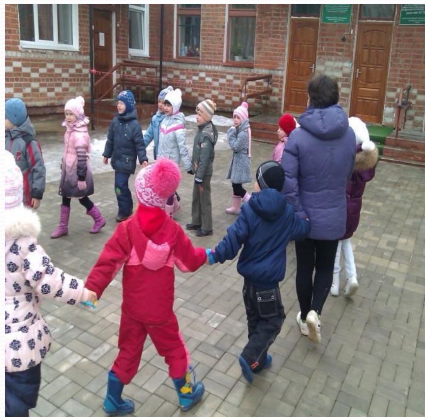
Прогулка (физические упражнения)