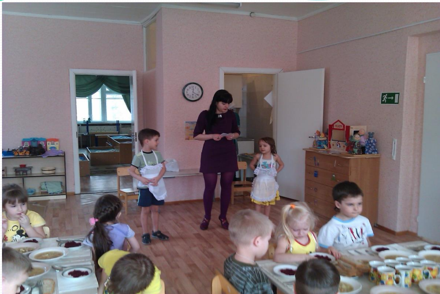
Дежурство по столовой