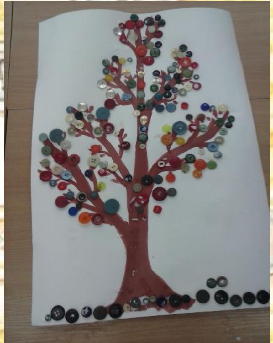
2. Подготовка 3. Декорирование готовой поделки.