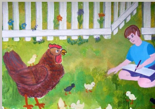
Жуков Ваня 7 лет

«Я радуюсь, что выйдя из дома могу потрогать зеленую травку!»