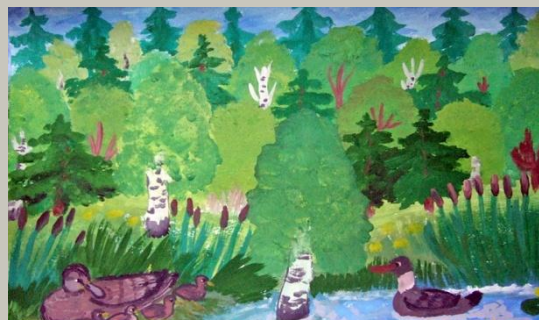
Кошелькова Аня 7 лет

«Я радуюсь, что выйдя из дома могу потрогать зеленую травку!»