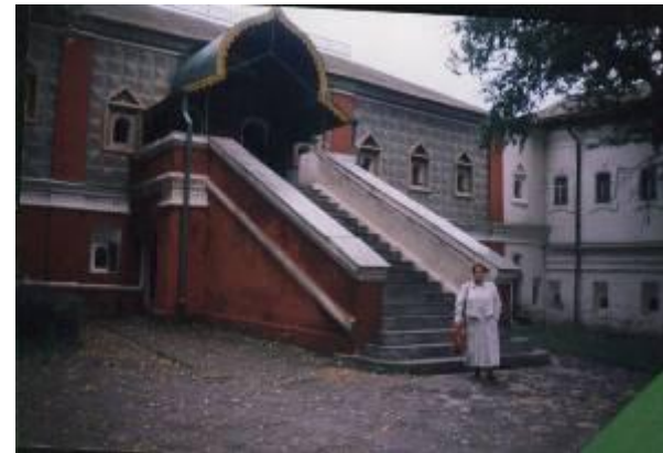
Палаты бояр Романовых