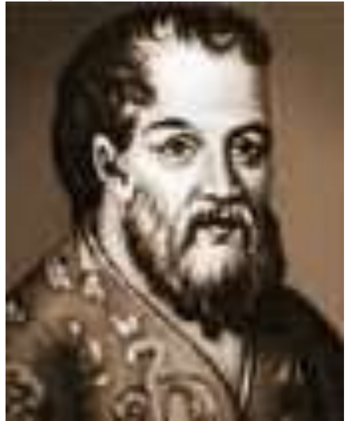
Дмитрий Михайлович Пожарский