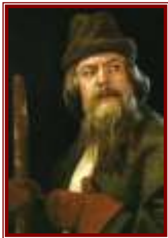
Иван Сусанин (роль в спектакле «Жизнь за царя»)