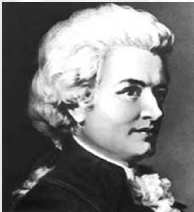
Вольфганг Амадей Моцарт