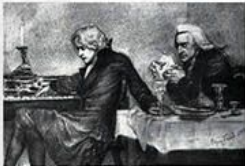
М.А. Врубель. Пейзаж с портретами Моцарта и Сальери. 1891.