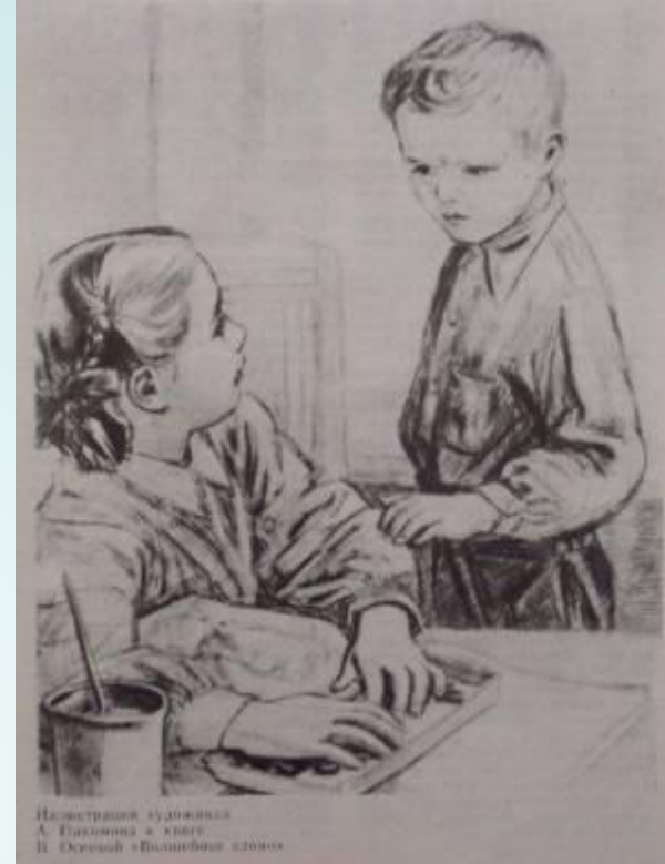
Иллюстрация художника А. Ефремова к книге В. Сорокина «Великий злодей»

Твоя подружка попросила тебе в антракте быстренько сбежать в буфет за бутербродами. Как ты поступишь?