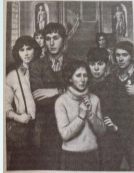
В музее. Художник Т. Федорова.

Тебя заинтересовала ткань на костюме боярина в музее. Можно ли её потрогать?