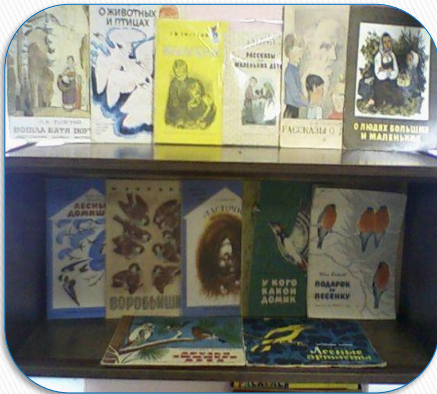
Книги о животных