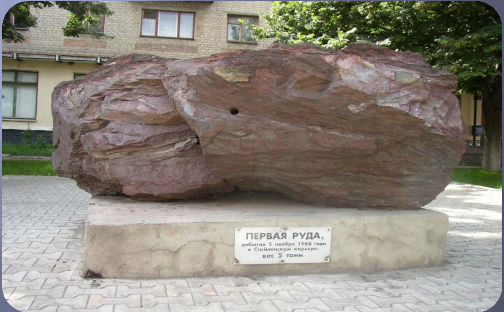
ПЕРВАЯ РУДА, добытая 5 ноября 1968 года в Стойленском карьере. вес 5 тонн