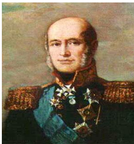
М. Б. Барклай- де- Толли 1761- 1818