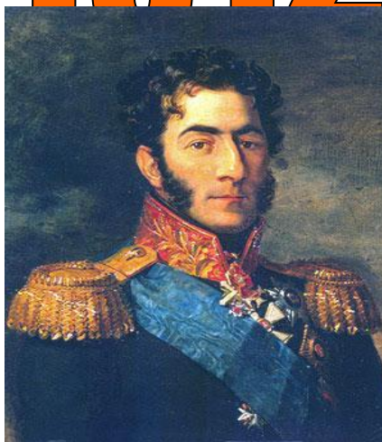
П. И. Багратион 1765- 1812