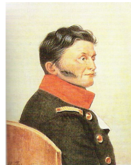
Н. Н. Раевский 1771- 1829