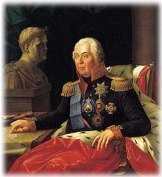
М. И. Кутузов 1745- 1813