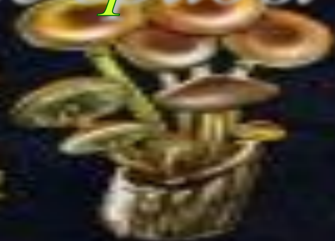
Валуха поганка Сатанинский Ложный опенок