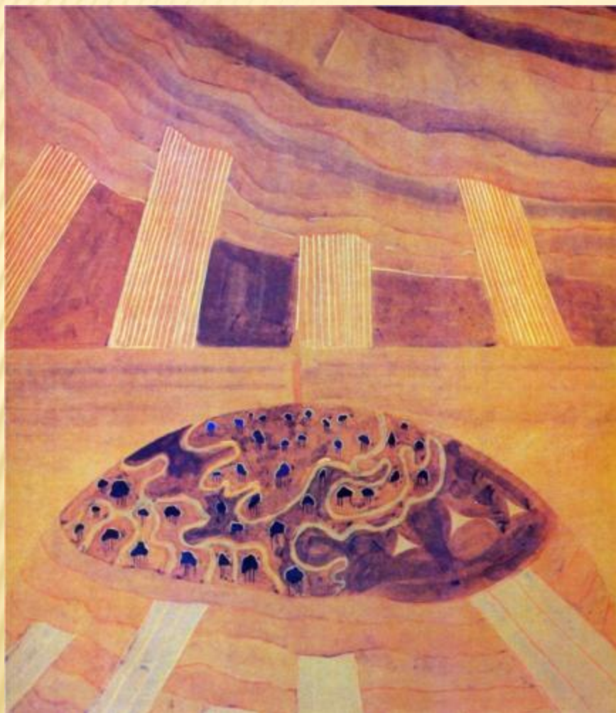
АНДАНТЕ (СОНАТА СОЛНЦА)

За свою недолгую жизнь он написал около 300 картин, многие из которых объединены в циклы: «Знаки зодиака», «Соната моря», «Соната солнца» и другие. Являясь основоположником музыкальной живописи, он разработал целую науку музыки цвета.