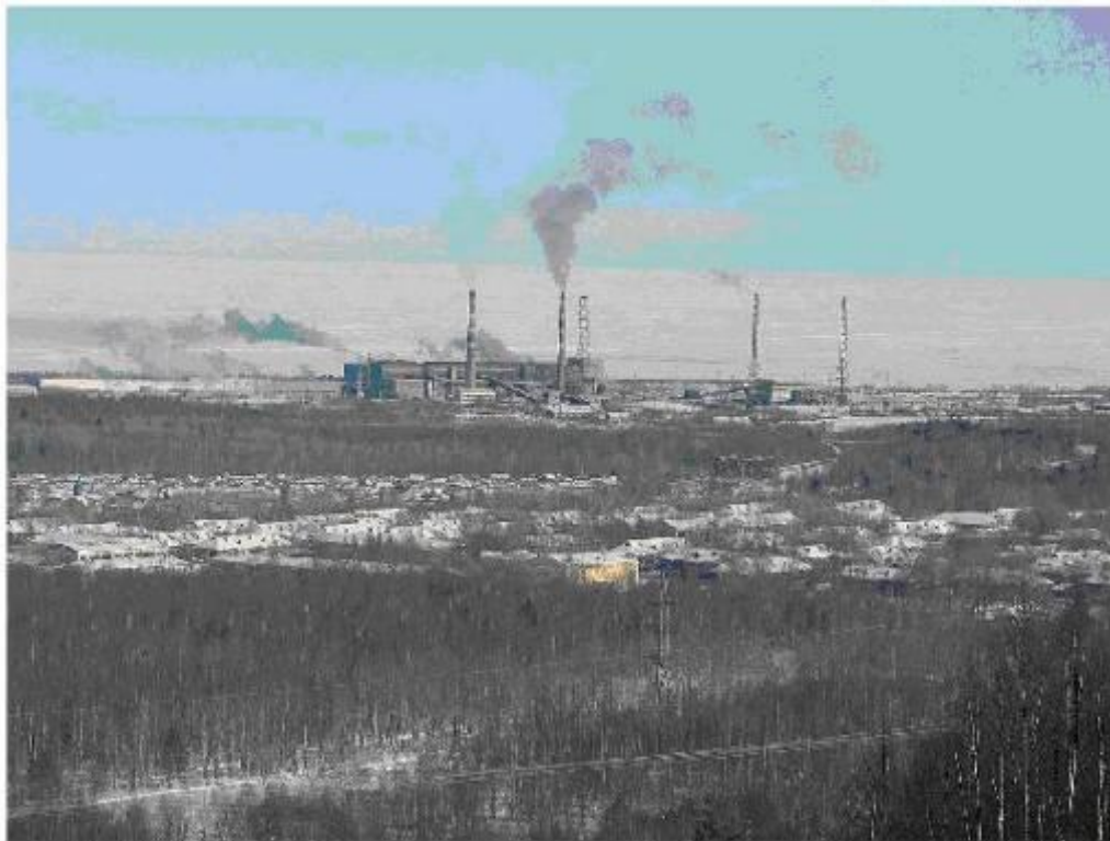
Байкальский целлюлозно-бумажный комбинат

Байкальский целлюлозно-бумажный комбинат (БЦБК) расположен в городе Байкальске, на юге западного берега озера Байкал. Его трубы видны с противоположного берега озера. Комбинат был запущен в 1966 г., выпускает сульфатную целлюлозу и оберточную бумагу.