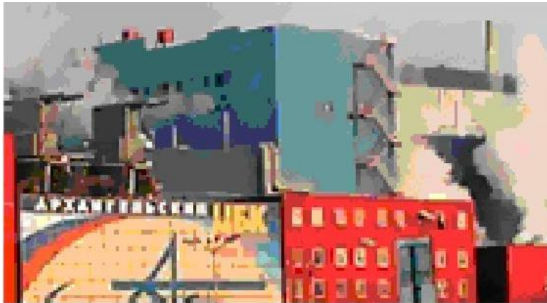
Архангельский целлюлозно-бумажный комбинат

Архангельский ЦБК является одним из крупнейших российских производителей целлюлозы и тарного картона — доля предприятия составляет 10% общероссийского производства этой продукции. Доля АЦБК по тарному картону составляет около 30% от общего объема этой продукции в России, по целлюлозе — 7%.