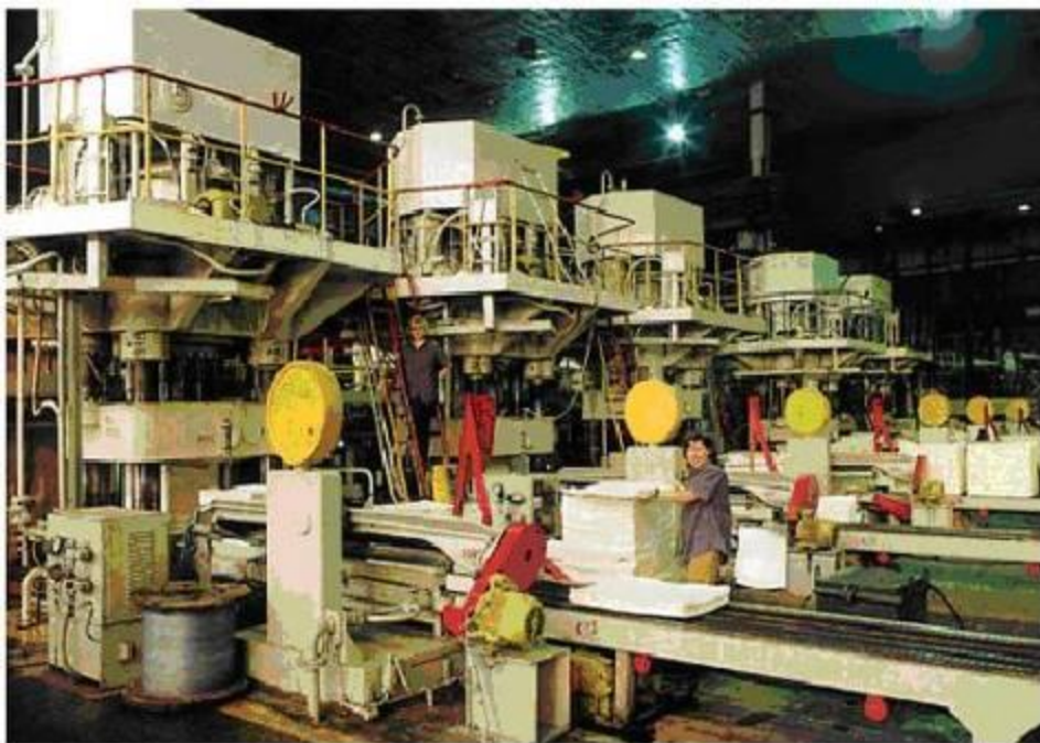
Братский целлюлозно-картонный комбинат

Корпорация ЗАО «Илим Палп Энтерпрайз» (Санкт-Петербург), в которую входит Братский целлюлозно-картонный комбинат, является широко известной компанией по производству товарной целлюлозы, занимает 6-е место в мире по арендованным лесным площадям и объемам заготовки леса.