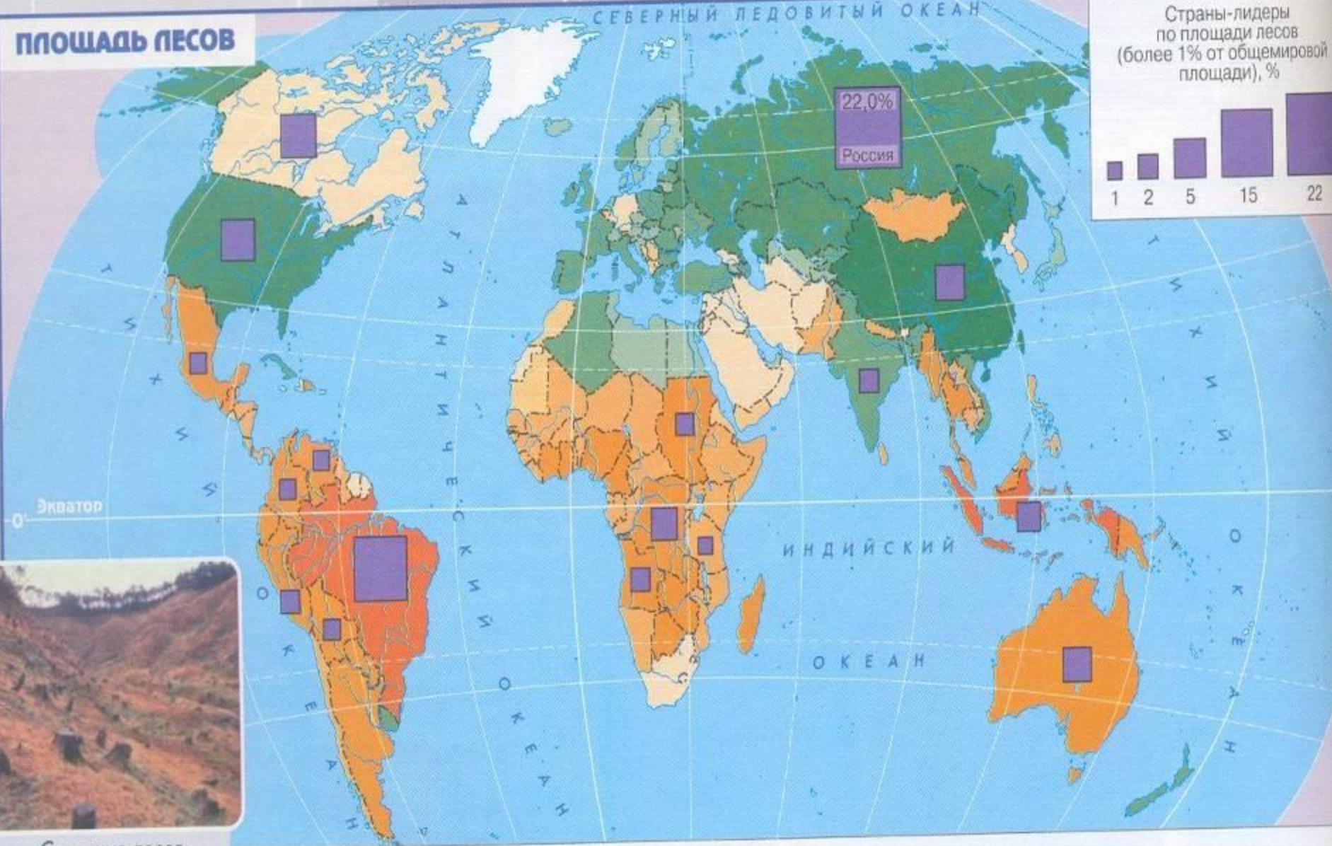
ИЗМЕНЕНИЕ ПЛОЩАДИ ЛЕСОВ ПО СТРАНАМ МИРА, 1990—2000 гг., тыс. га