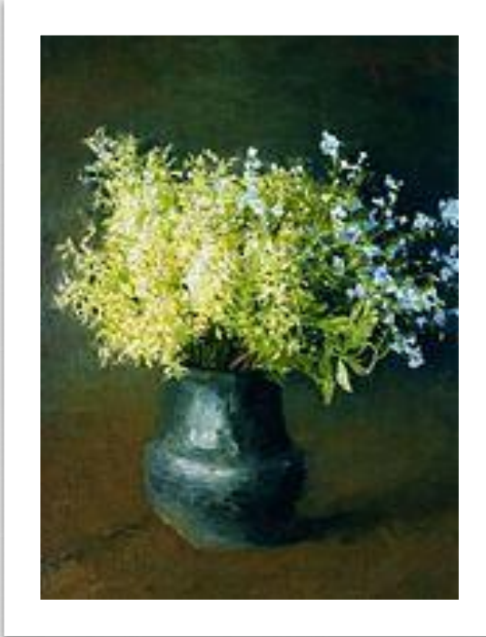
Лесные фиалки и незабудки