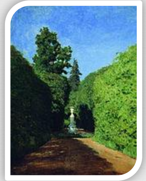
Аллея. Останкин о