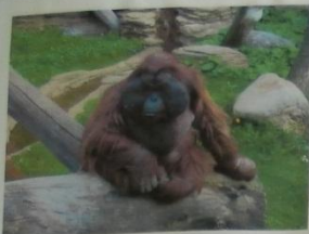
Животные южных стран