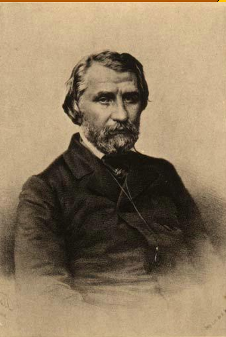
Иванъ Серг. ТУРГЕНЕВЪ. Авторъ „Записокъ охотника“. (1818—1883)