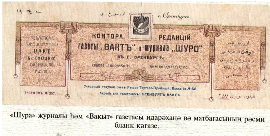
«Шура» журналы һәм «Вакыт» газетасы идарәханә вә матбагасының рәсми бланк кәгазе.

1906нчы елдан Р.Фәхреддин Уфадан Оренбург шәһәренә күчә. «Вакыт» газетасында, 10 ел буе «Шура» журналында эшли. Р. Фәхреддин тарафыннан барлығы 50 исемдә 147 китап бастырыла. Шулай ук аның 100 томга яқын зур күләмле кулъязма хезмәтләре барлығы билгеле. 1918нче елда Р. Фәхреддин Уфа шәһәренә күчә. 1922нче елда аны мөфти итеп билгелиләр. Ул бу хезмәтенә тиешле сәгатләрен бирсә, калган бөтен вакытын фәнгә багышлый, архивта эзләнә, тарихи хезмәтләр өстендә эшләвен давам итә. Фән өчен гаять зур әһәмияткә ия булган «Болгар тарихы» дигән күләмле әсәрен яза.