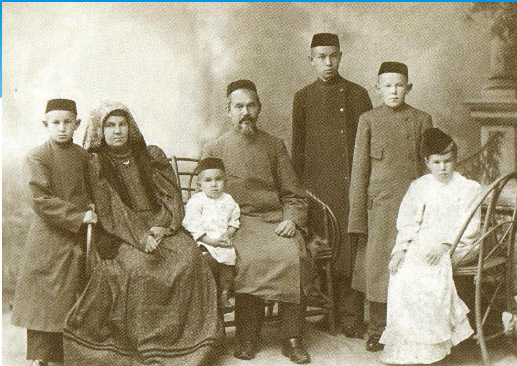
1902нче елның 28нче сентябрэндә ясалган фото.