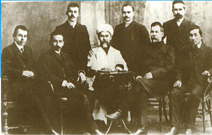
«Шура» журналы һәм «Вакыт» газетасы идарәханәсендә.