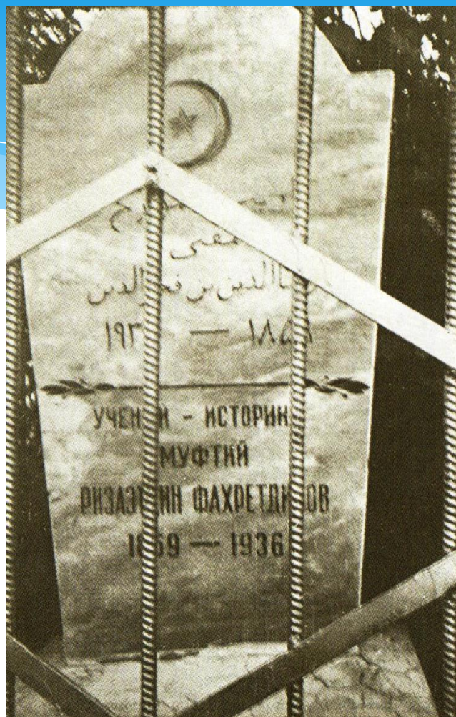
Р.Фәхреддин кабере. Уфа.

Оренбург шәһәрндә 1986нчы елның 1нче сентябрдә Правда урамы 9нчы йортка куелган истәлек тактасы.