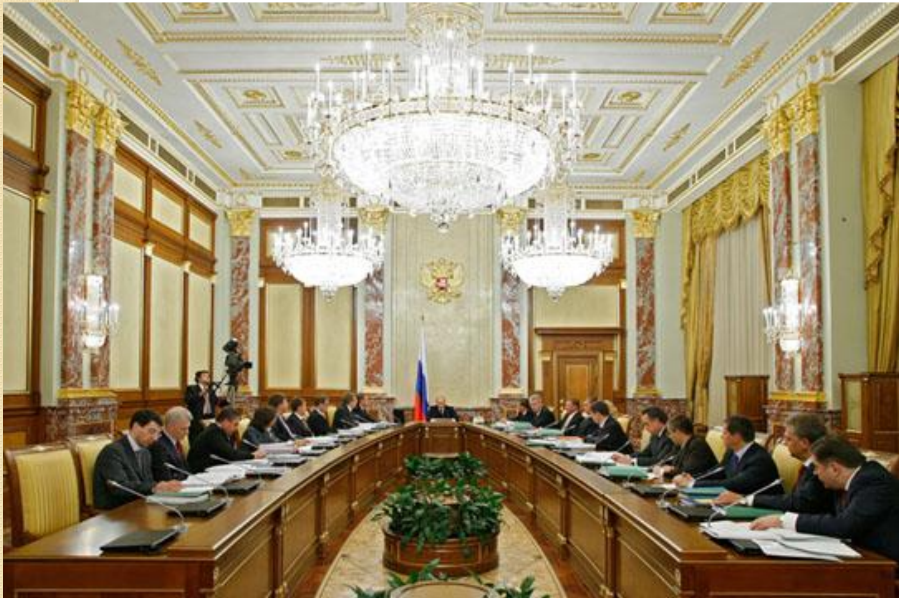
Заседание Правительства РФ