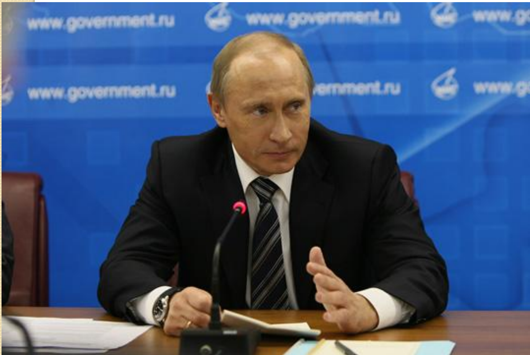
Председатель Правительства Российской Федерации В.В. Путин