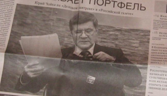
Юрий Чайка на «Деловом завтраке» в «Российской газете»

Книга перемен: четыре новых главы Борис Грызлов Всероссийский конкурс «Легенды России» Ничего не забыто Диска ничто новый футбольный сезон в Англии, а «Зенит» в родном Питере Сами мы местные С 1 января 2011 года Совет Федерации будет формироваться по новой схеме Утверждали план работы