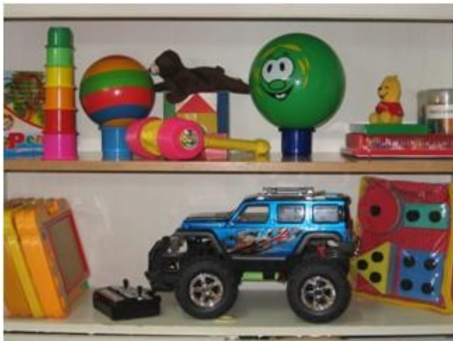
Зона игрового сопровождения