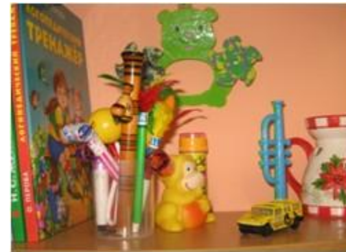
Зона развития речевого дыхания