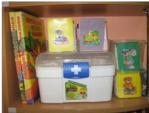
Зона коррекции произношения