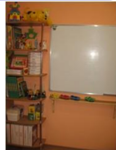
Зона дидактического сопровождения