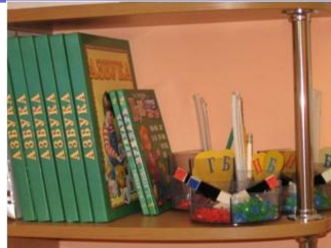
Зона методического сопровождения