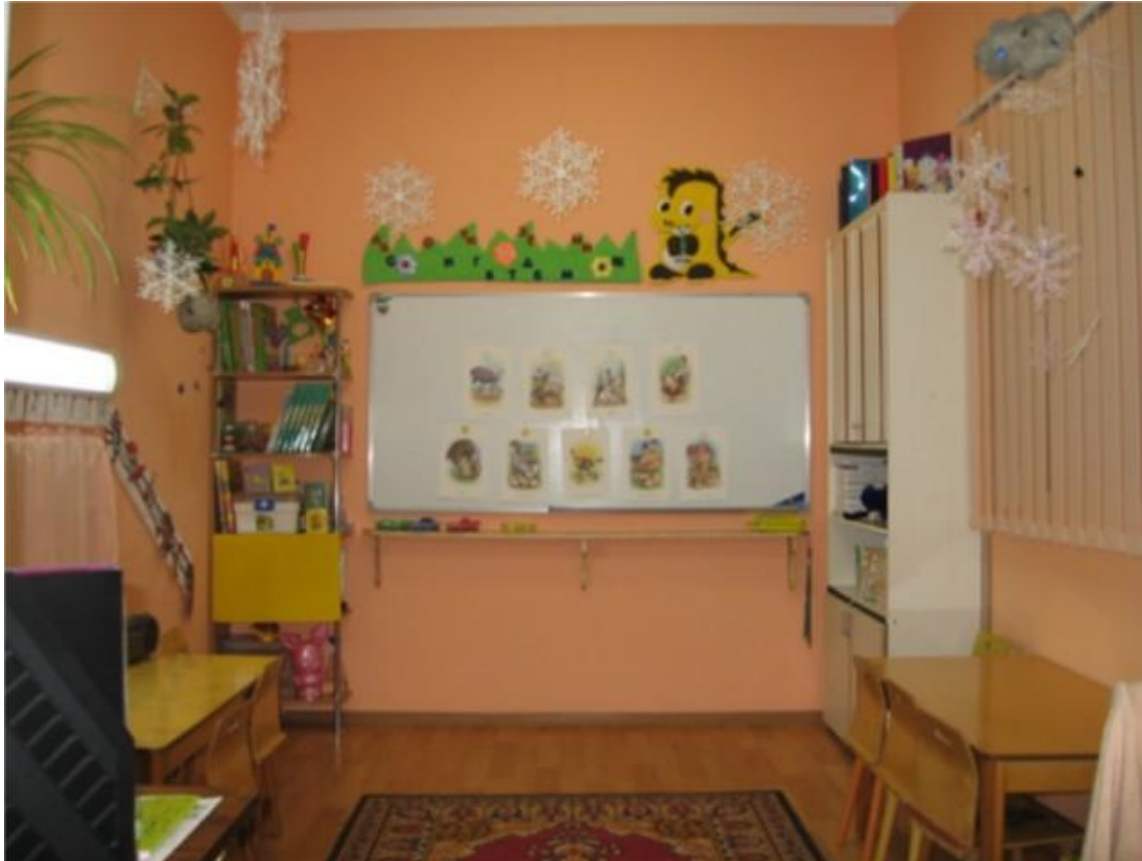
Общий вид кабинета