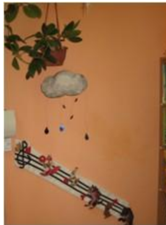
Зона развития фонематического слуха