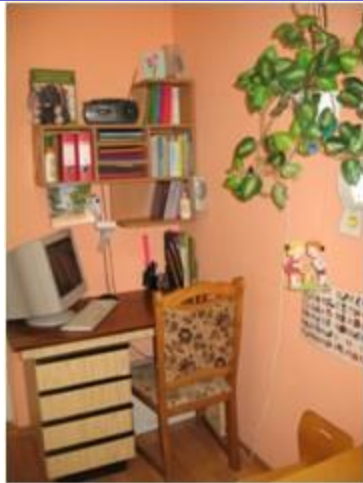
Зона технических средств обучения