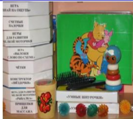
Зона развития мелкой моторики