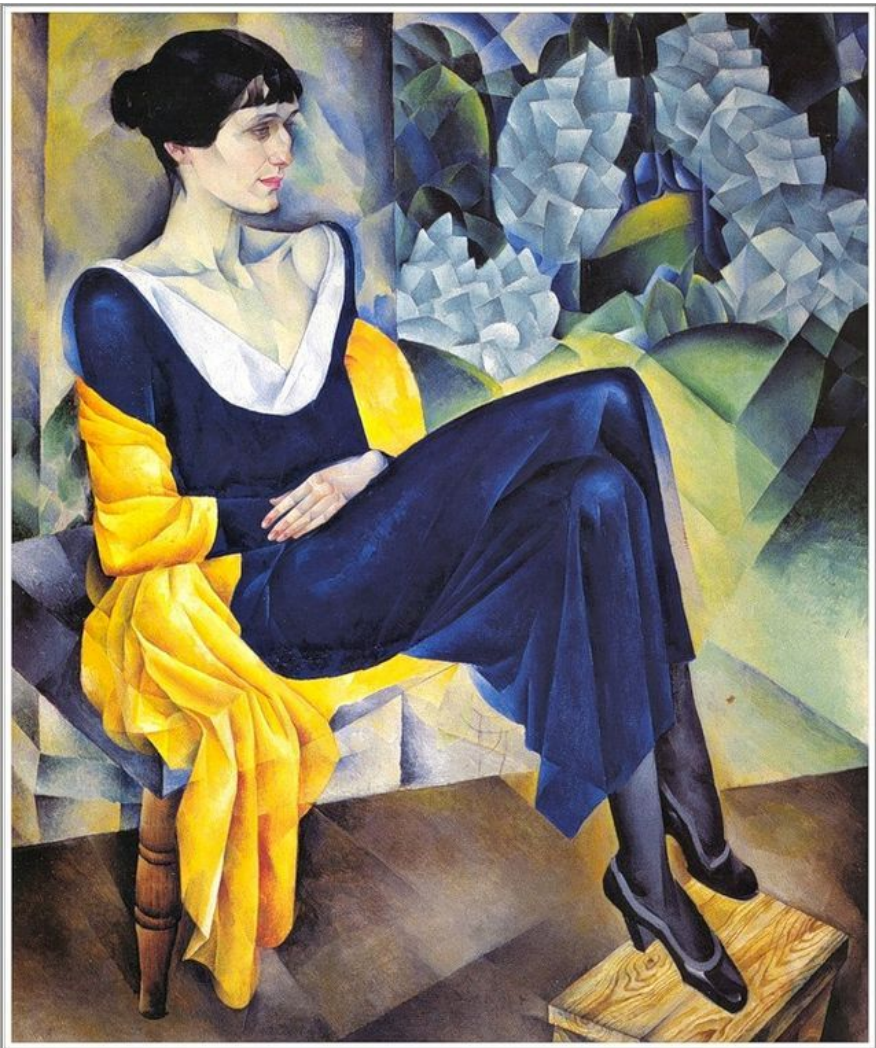
Н. Альтман. Портрет А. А. Ахматовой, 1914 год. Русский музей