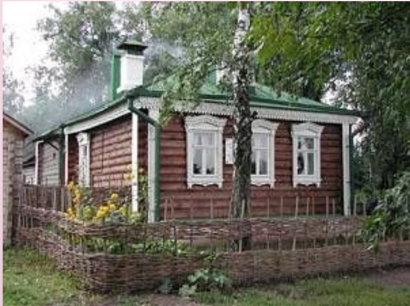
□ Дом-музей Сергея Александровича Есенина