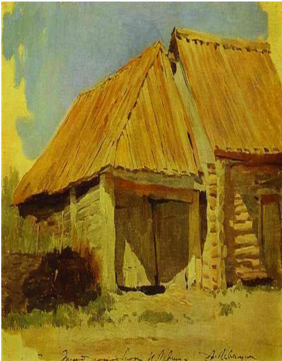
АМБАР – помещение для хранения зерна и припасов