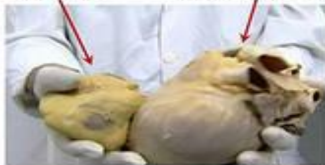
Сердце умеренно пившего пиво