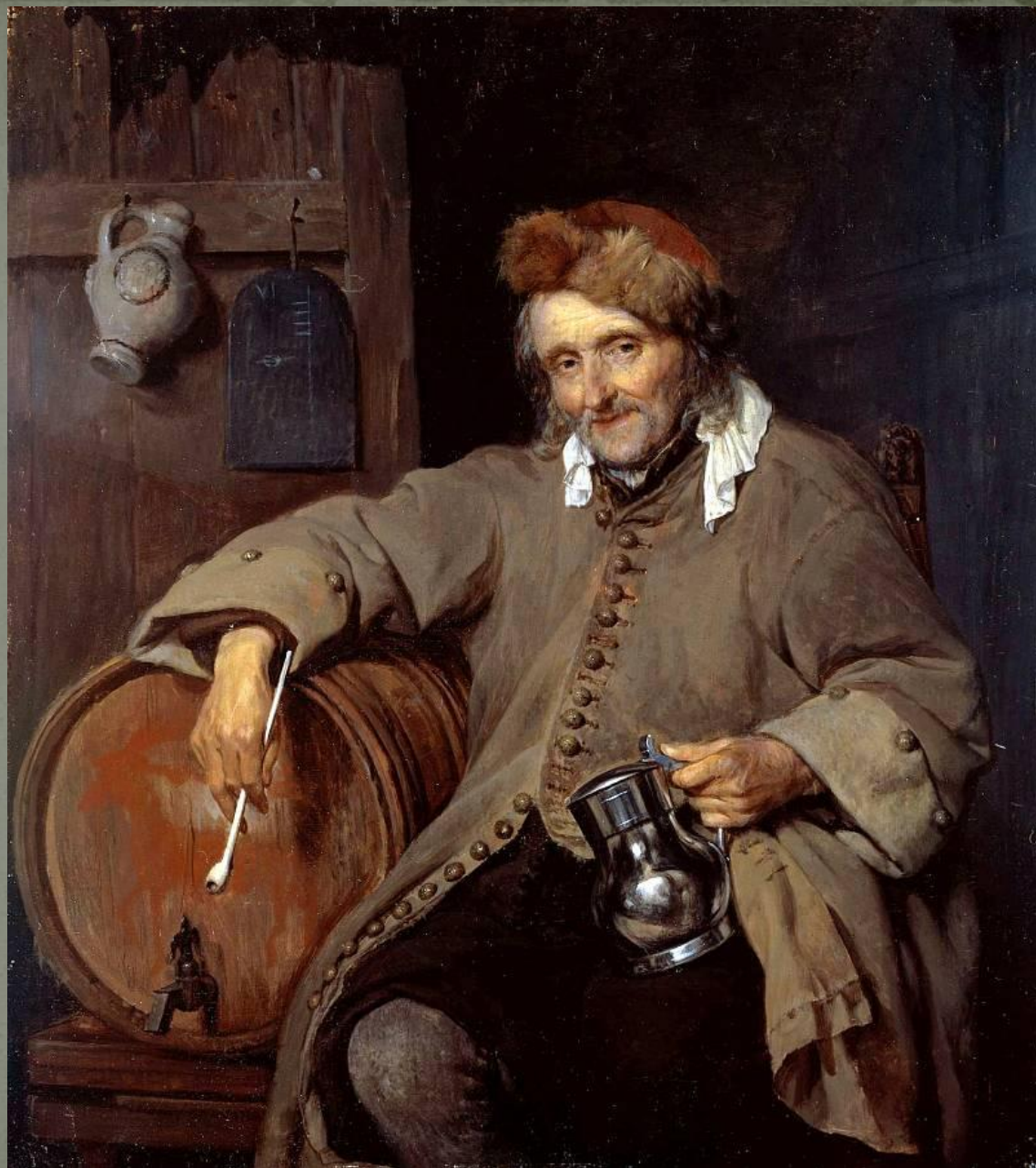
Ян Вермеер Делфтский (1632–1675)