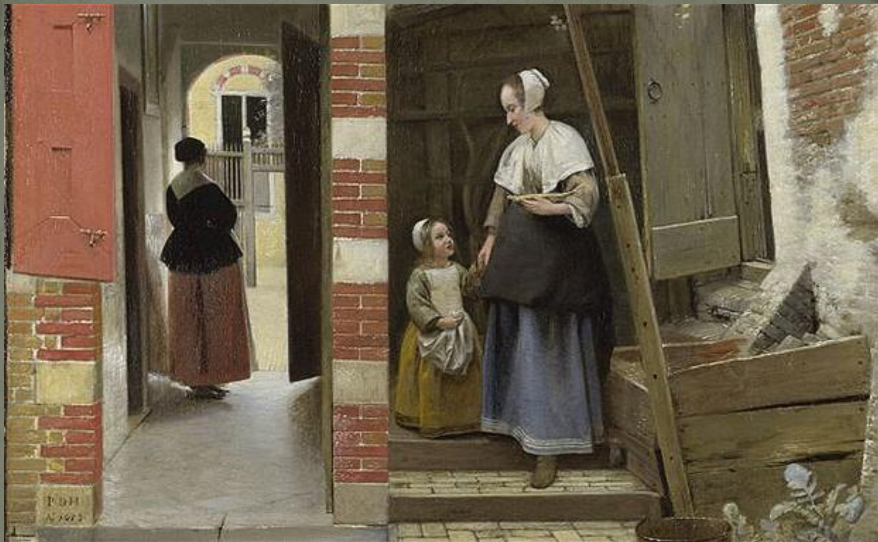
Ян Вермеер Делфтский (1632–1675)