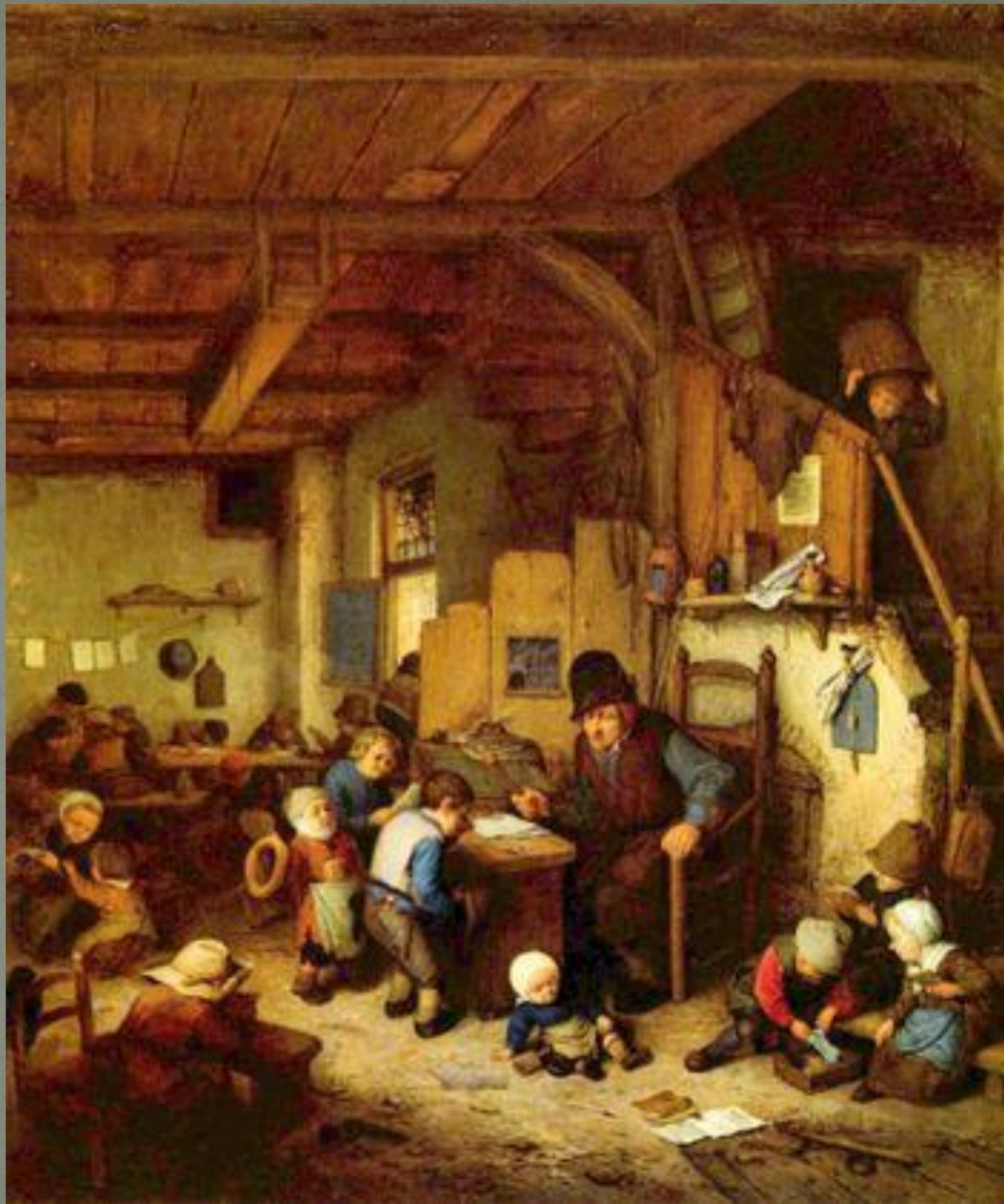
Адриан ван Остаде "Школьный учитель", 1662, Лувр