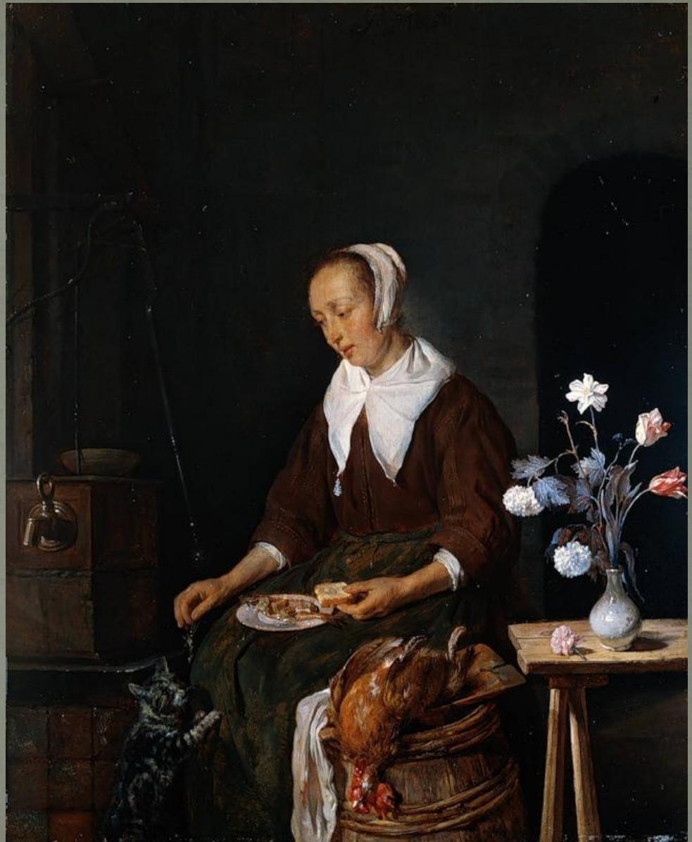
Ян Вермеер Делфтский (1632–1675)