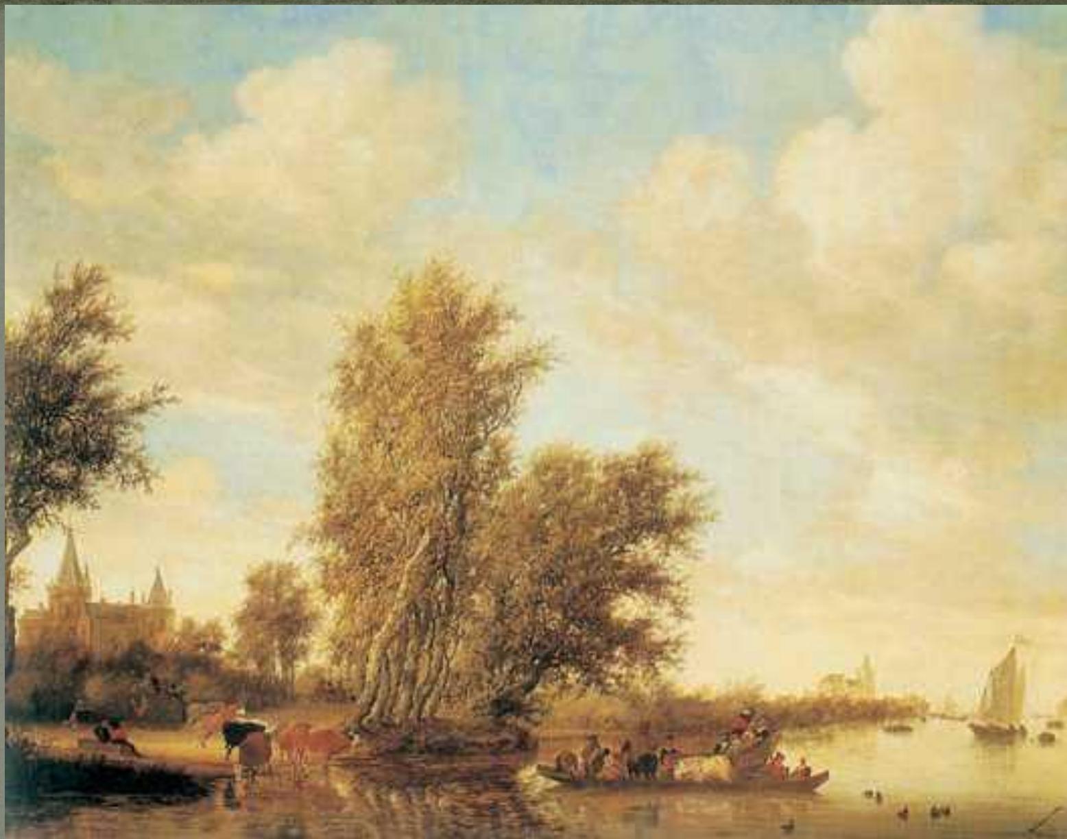
Я. ван Гойен. «Речной пейзаж». 1631 г.