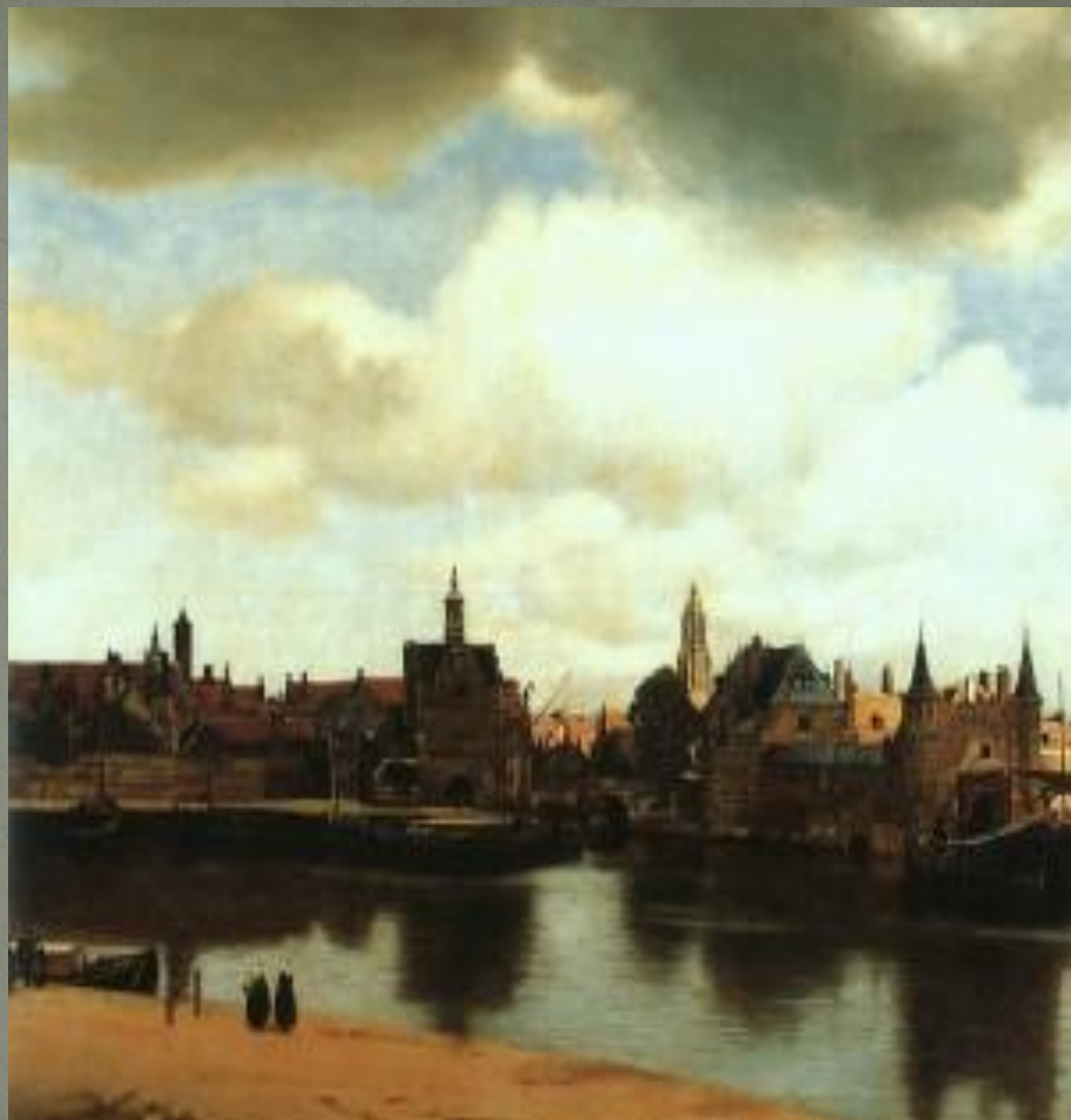
Ян Вермеер Делфтский. Вид Делфта, 1660