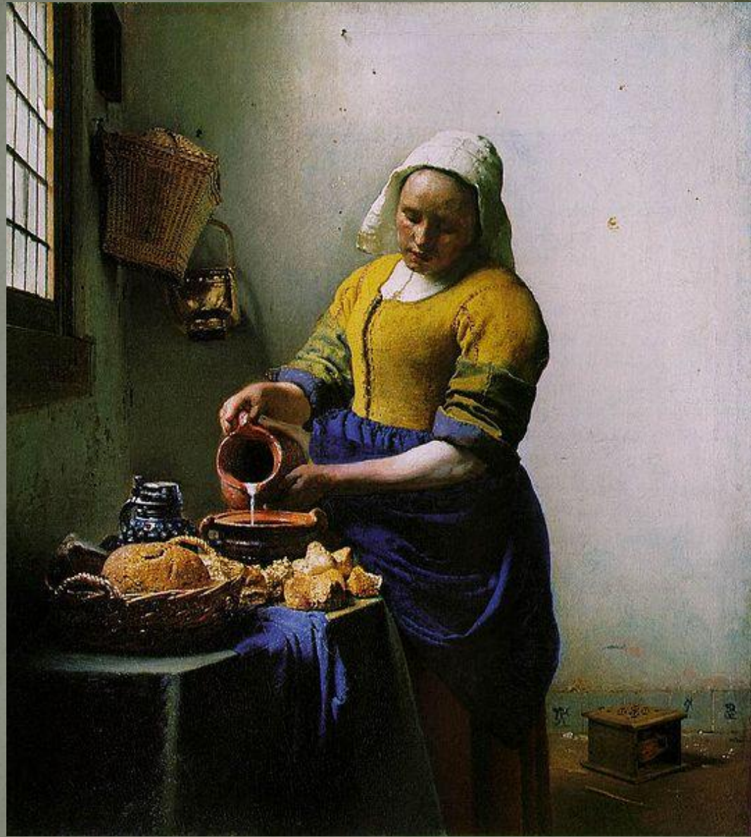
Ян Вермеер Делфтский (1632–1675), голландский живописец