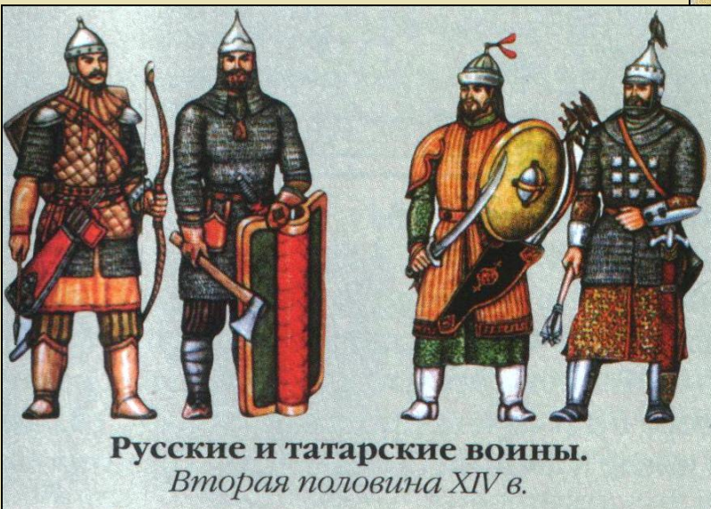
Русские и татарские воины. Вторая половина XIV в.