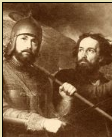
К. Минин и Д. Пожарский