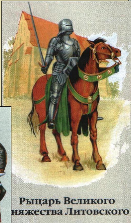
Рыцарь Великого княжества Литовского