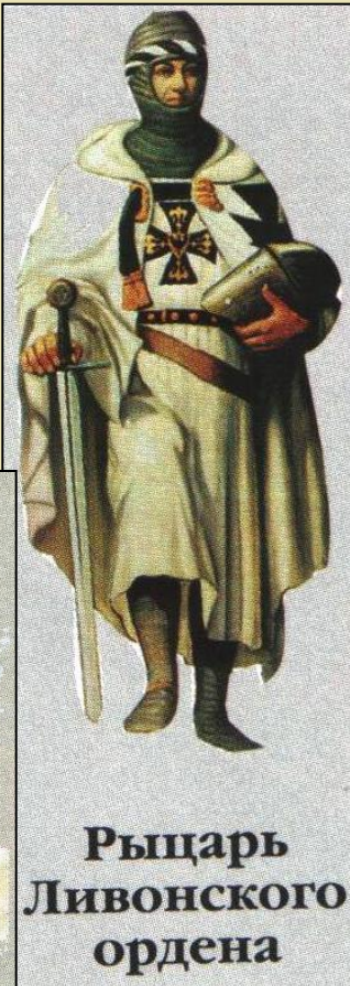
Рыцарь Ливонского ордена