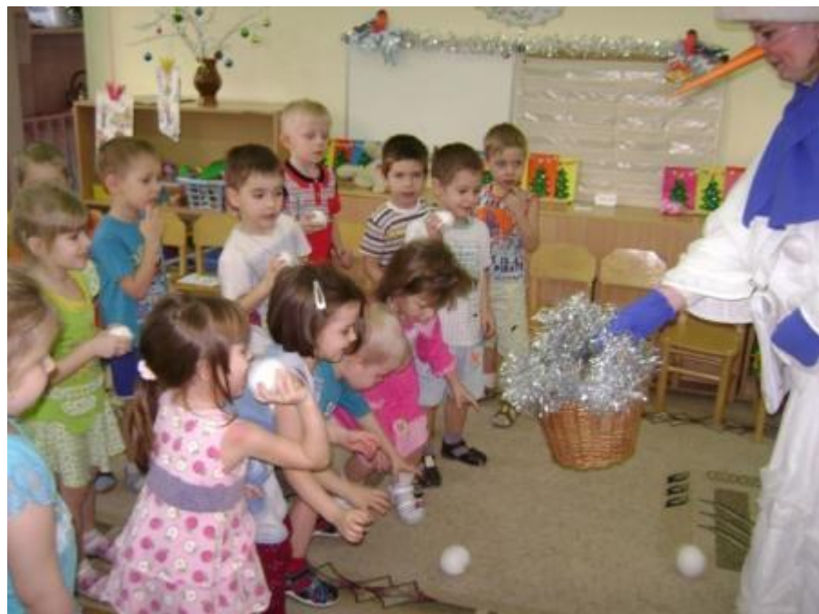
Веселые игры и конкурсы