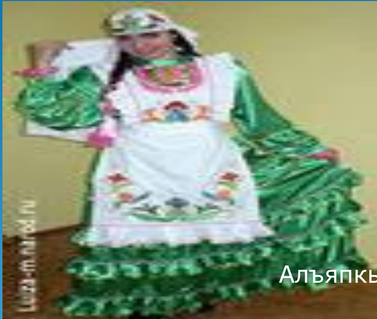
Альпкыч өчен үлчәү алу