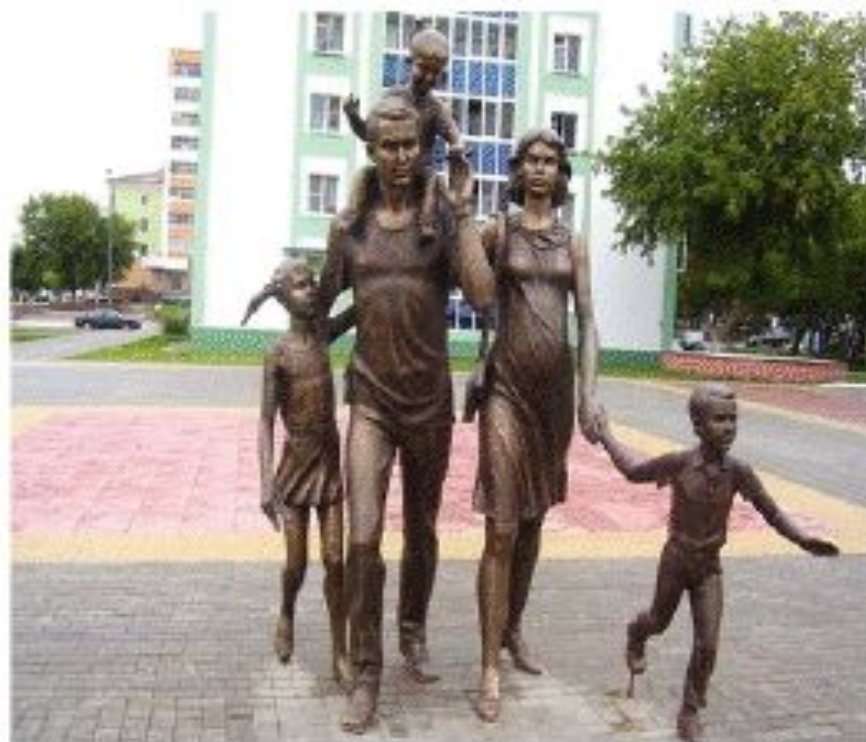
Памятник семье в Саранске