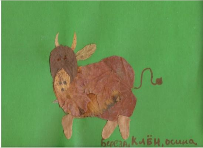
БЕРЕЗА, КЛЁН, ОСИНА,