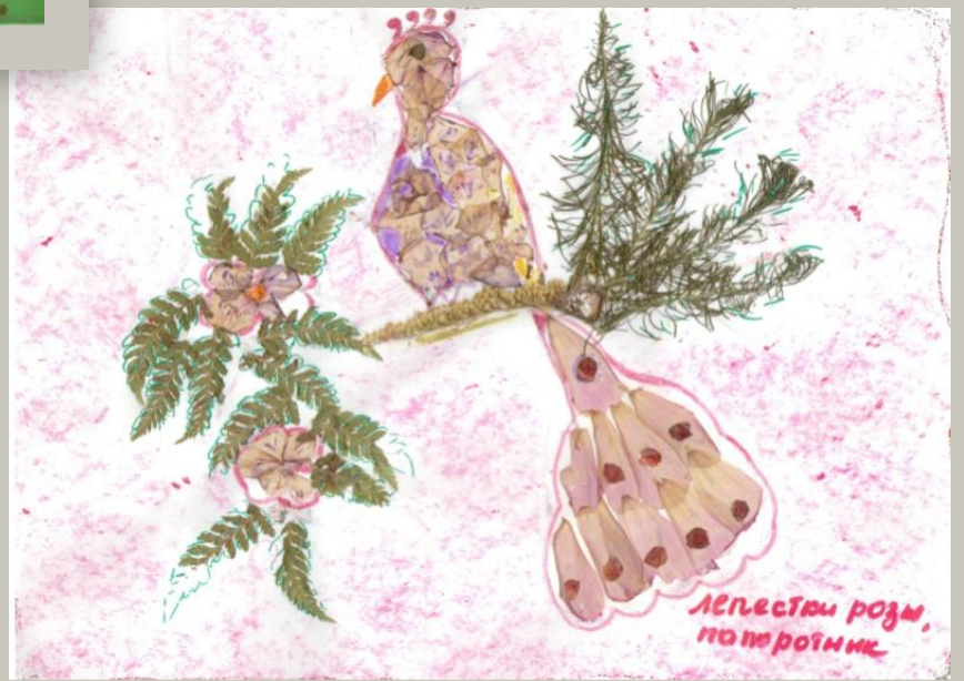
Лепестки роз, по тропинке