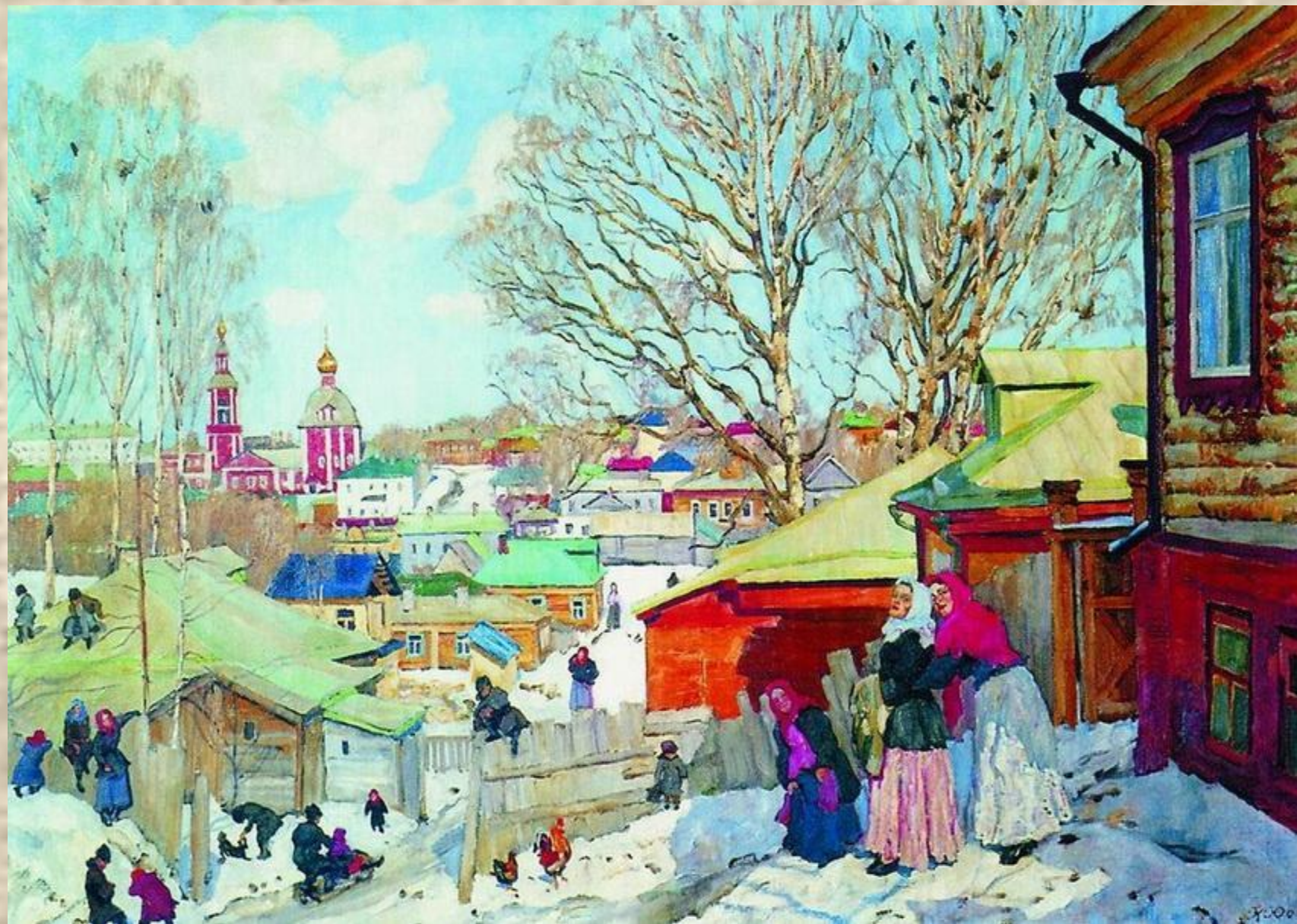
Весенний солнечный день.