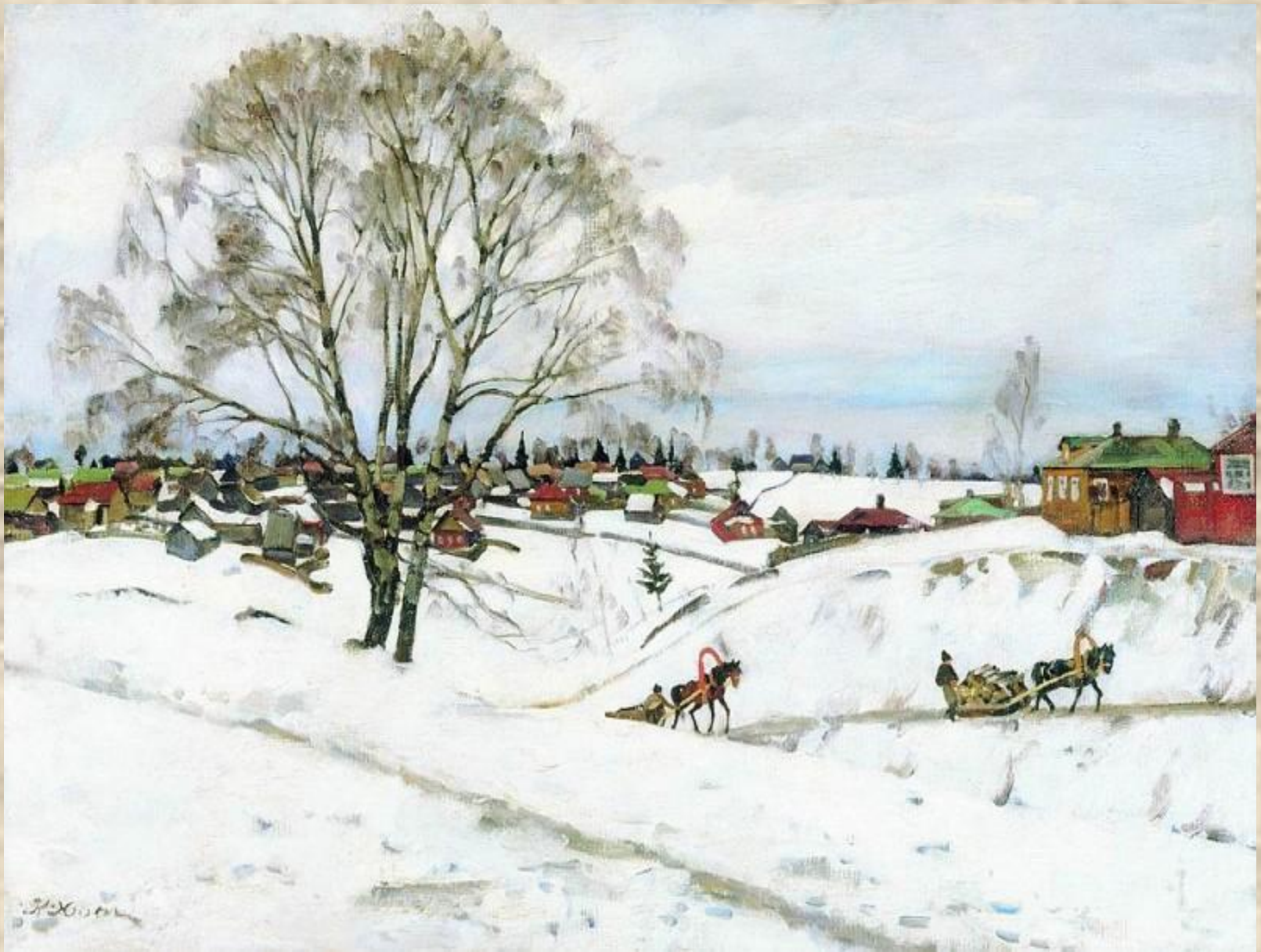
Зима. Сергиев посад.