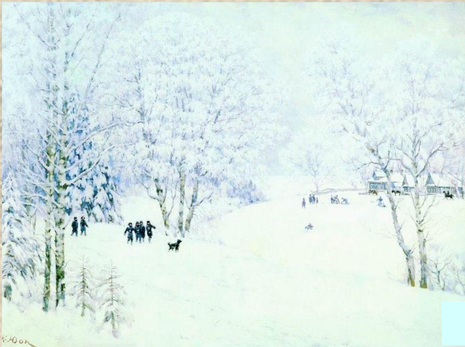
Русская зима. Лигачёво.