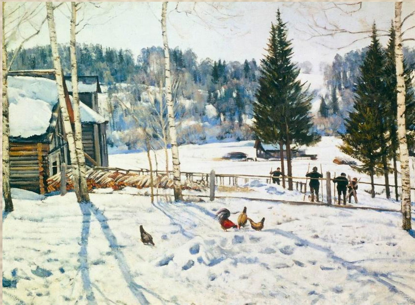
Конец зимы. Полдень.