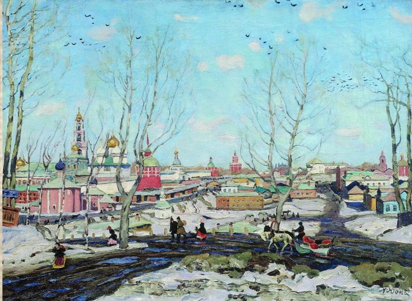
Весна в Троицкой лавре.