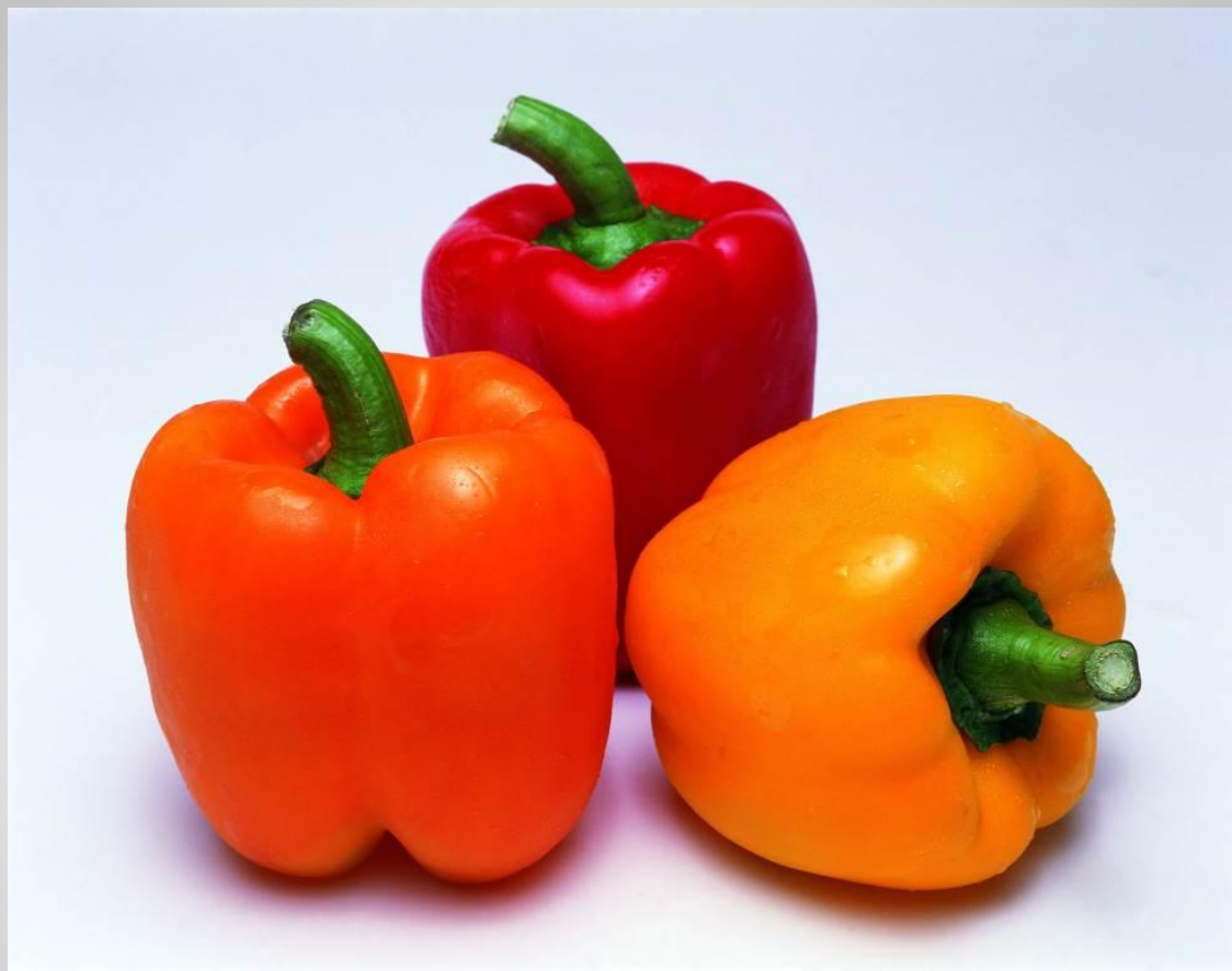
Перец - борыч