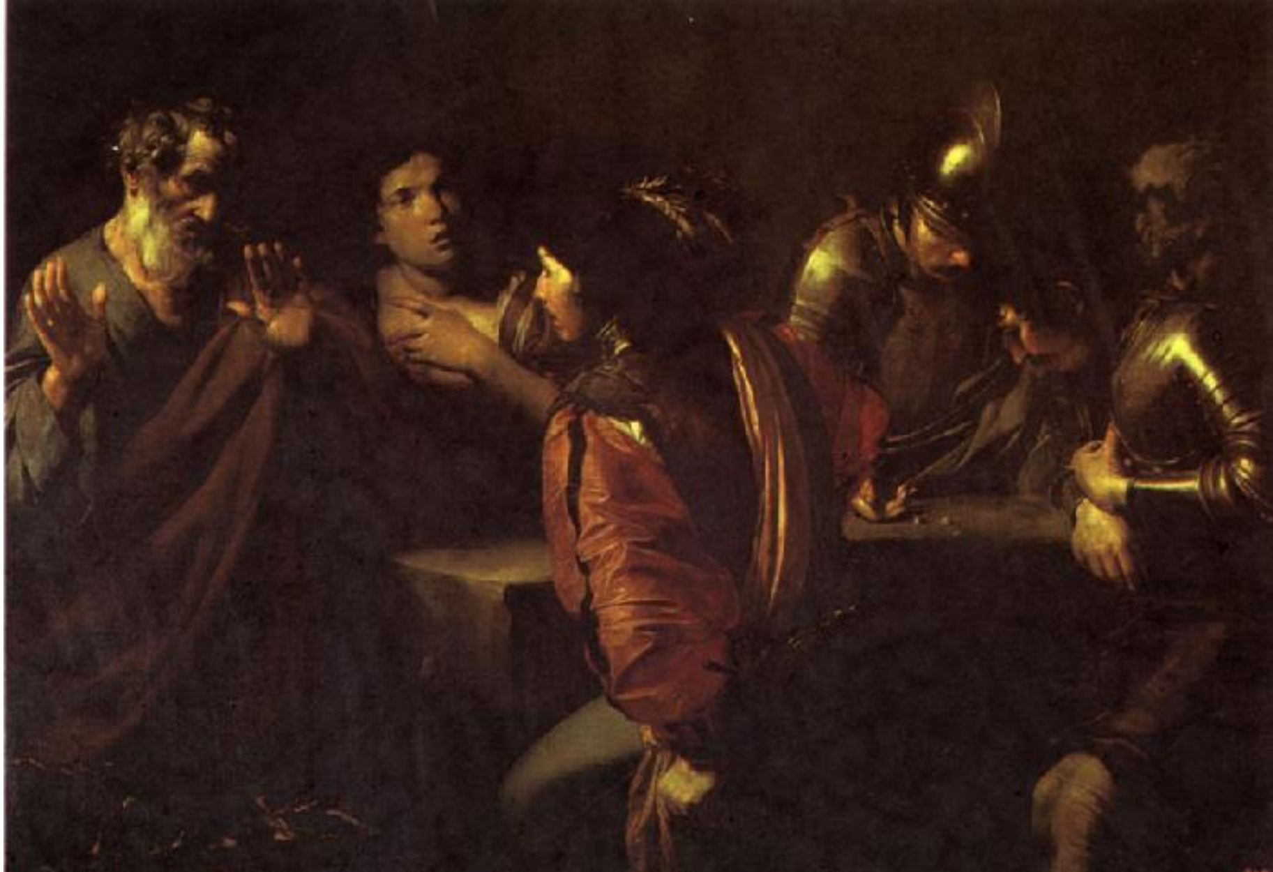
Валантен де Булонь «Отречение Святого Петра»