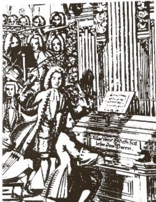
Из трактата М. Преториуса «Syntagma musicum». 1615–1619

Die Spinett mit einem Pfeifen / und deren mit einem / Stucklein: Die te / vierde / oberste Spielart / off / sechs / und acht / und / zwanzig / und / 1. / Buch 2. / 171.