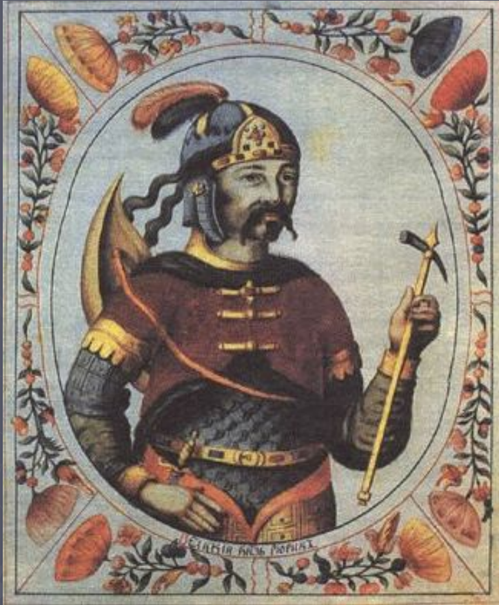
Игорь (912 – 945)