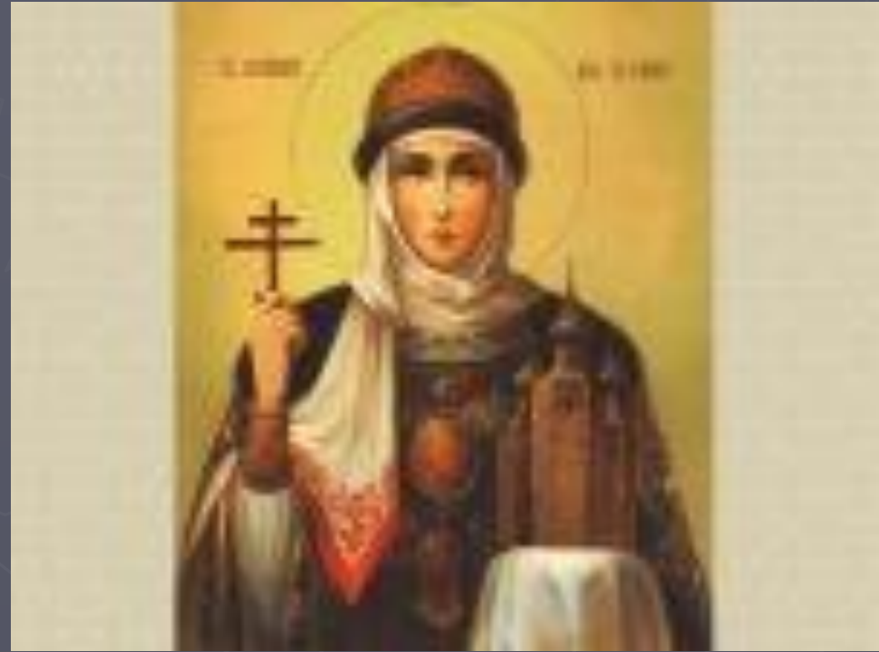
Ольга (945 – 957)