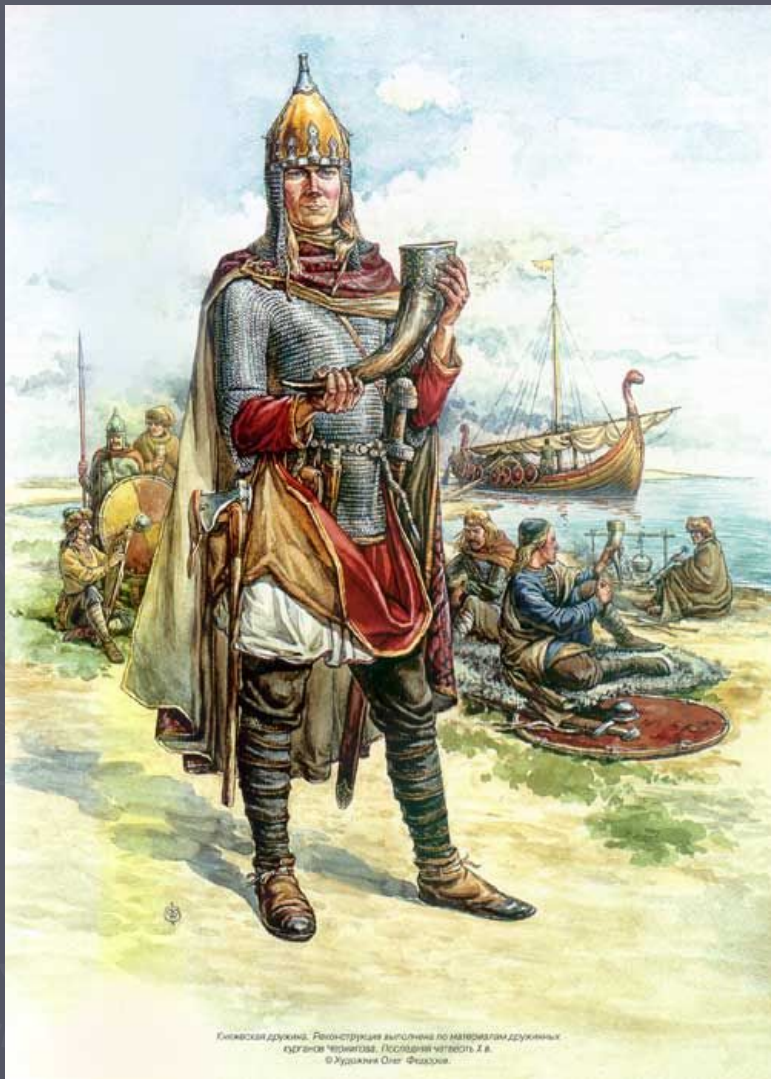
Киевская дружина. Реконструкция выполнена по материалам дружинных одеяний Чернигова. Последняя четверть X в. © Художник Олег Фёдоров

907 г. – торговый договор, который содержал выгодные для русских купцов условия; 911 г. – первый письменный договор