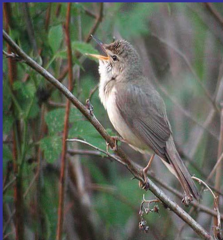
Камышевка садовая - Acrocephalus dumetorum

1. Дедушка увидел птицу-неслышимку над ручьём на вершине ольхи.